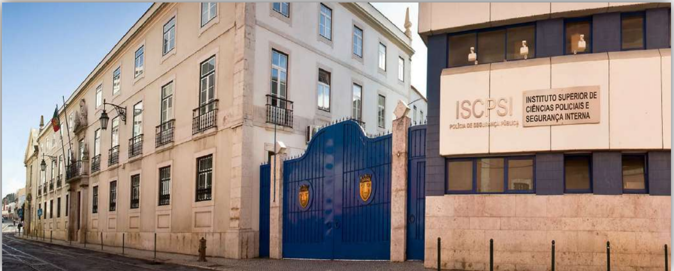
Figura 1: Fachada principal do ISCPsi.