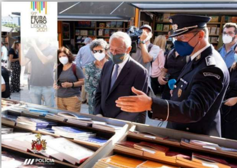
Figura 2: Visita do Presidente da República Portuguesa ao expositor do ISCPSI/ICPOL na Feira do Livro de Lisboa 2021.

h) A celebração de convénios com instituições universitárias e unidades de investigação e desenvolvimento nacionais e internacionais.