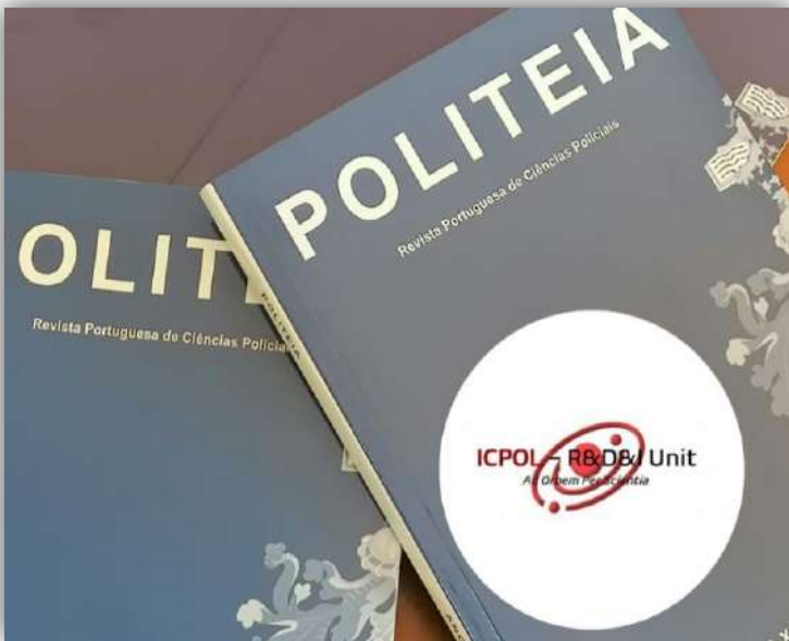
Figura 4: Capa da Politeia – Revista Portuguesa de Ciências Policiais (ISSN 1640-0367).