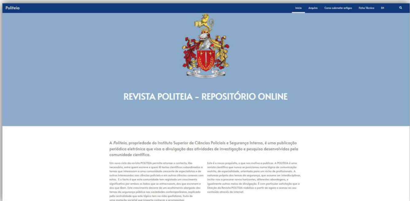
Figura 5: Aspeto da entrada do repositório digital da Revista Politeia, de acesso gratuito e disponível em politeia-online.pt.