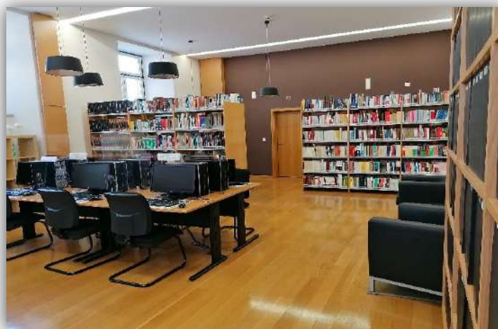
Figura 3: CDI/ICPOL e Biblioteca da PSP no edifício principal do ISCP/ISI.

Esta unidade de ID&I tem ao seu cuidado a área onde estão instalados o Centro de Documentação e Informação (CDI) e a Biblioteca da PSP – secção do rés do chão, do edifício principal do antigo Convento do Calvário. Refira-se que, na extensão da sua missão, o CDI dispõe ainda no edifício de um ponto de vendas e de um balcão de atendimento ao público e organismos/serviços, de modo a informar, encaminhar e orientar o utente no âmbito dos recursos bibliográficos disponíveis.