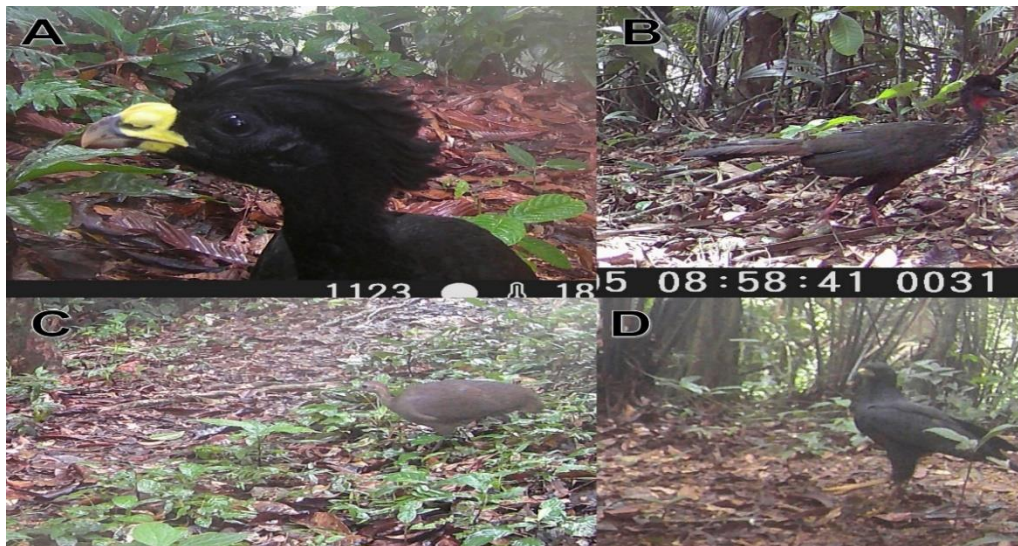
Ejemplo de algunas especies amenazadas debido a la presión antropogénica registradas en la Reserva del Valle Mamóní. A) Crax rubra, B) Penelope purpurascens, C) Tinamu major y D) Buteogallus urubitinga