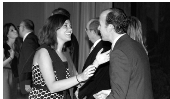
Los recién diplomados reciben la felicitación de los miembros de la mesa presidencial

duda uno de los más bellos de España. La ocasión, no obstante, lo merecía, pues lo que se celebraba era la ceremonia de entrega de la XXIII edición del Premio «Estudios Financieros», además de la tradicional