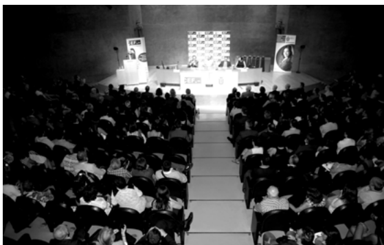
Visión panorámica del auditorio AXA

Tras la intervención del rector, empezaron a producirse los primeros pasos de la maratón hacia el pretendido y deseado éxito personal y profesional, que día a día tendrán que recorrer los que con paso firme y seguro se acercaban al estrado a recoger su «beca o banda académica» al oír con satisfacción que su nombre formaba parte de la lista de graduados y másteres del CEF.-UDIMA de 2012-2013.