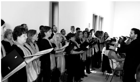
El coro universitario entonando el Gaudeamus Igitur

La Universidad a Distancia de Madrid puso a prueba su capacidad organizativa con motivo de la ceremonia de graduación de la promoción 2013, la segunda que se celebra en esta todavía joven pero cada vez más pujante universidad a distancia. El evento, celebrado el pasado 5 de octubre en el campus de Collado Villaba, sirvió también para dar apertura oficial al curso académico entrante. En la ceremonia, no solo recogieron sus diplomas y becas los recién egresados en las carreras que forman parte de la oferta de estudios superiores de la UDIMA, sino que también lo hicieron los estudiantes de los distintos másteres oficiales que esta universidad imparte en estrecha colaboración con su institución hermana, el CEF.-. Todo ello supuso que el reto no fuera baladí, puesto que eran