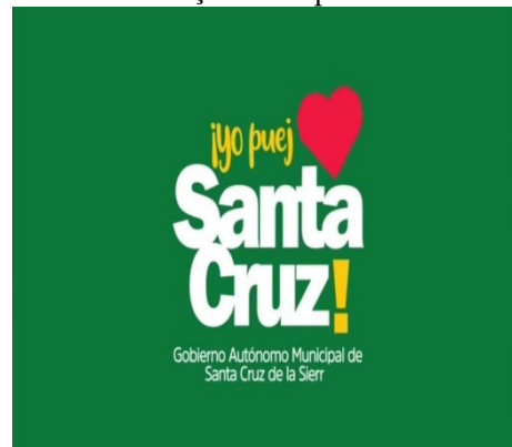
Figura 4 - Substituição da supressão do fonema /s/ > [h] > [j]