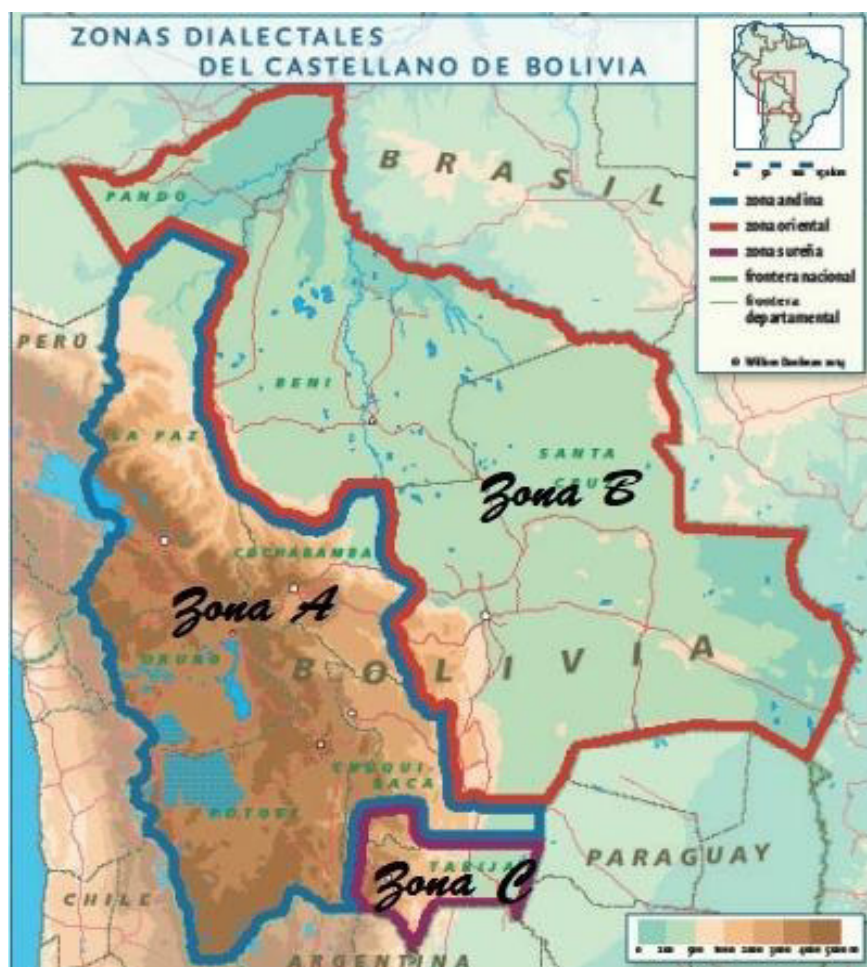
Figura 1 - Mapa linguístico do castelhano boliviano

planícies, conforme aparecem respectivamente na Figura 1, Zona A, Zona B e Zona C. No aspecto linguístico, segue uma perspectiva de convívio entre as línguas nativas e o castelhano, coabitando esses territórios de maneira natural, revertendo na constituição das variedades linguísticas do castelhano falado na Bolívia. Os estudos dialetais utilizados nesta pesquisa estão centrados em três grandes áreas linguísticas, como exposto na Figura 1.