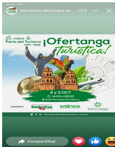
Figura 5 - Uso do sufixo aumentativo – anga