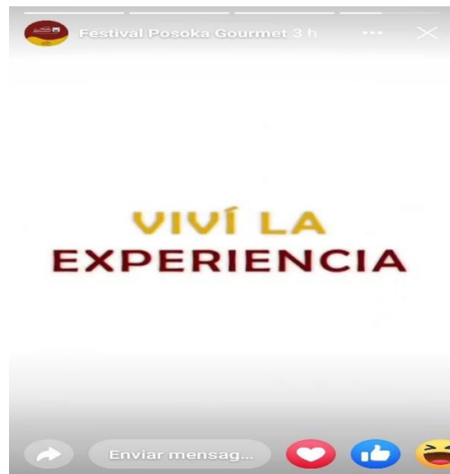
Figura 3 - Uso do verbo vivir conjugado para a segunda pessoa singular (vos) no modo imperativo.