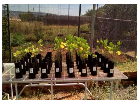
Figura 1 - Mudanças de mulungu em seus respectivos tratamentos, UNEB, Barreiras – BA, 2018.

A terra de subsolo foi retirada a partir de uma camada de 20 cm dentro do Campus da UNEB e, em seguida, peneirada. A vermiculita (vermifloc) e o composto orgânico foram obtidos em lojas de produtos de jardinagens. A areia foi retirada do Rio da Prinha da cidade de Barreiras – BA e o esterco bovino foi curtido por um mês antes da utilização.