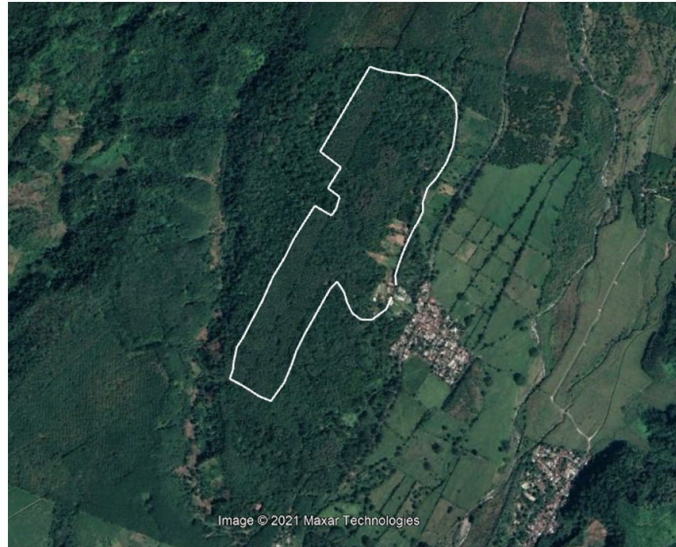
Figura 2. Transecto de observación en la parte oeste de la FUSJ.

entre las 06:00 y las 9:00 horas y entre las 15:00 y las 18:00 horas durante los meses de octubre y noviembre del año 2021.