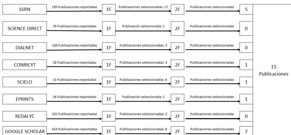
Figura 03 – Gráfico de elección de investigaciones primarias

1F = 1er Filtro. 2F = 2º Filtro.