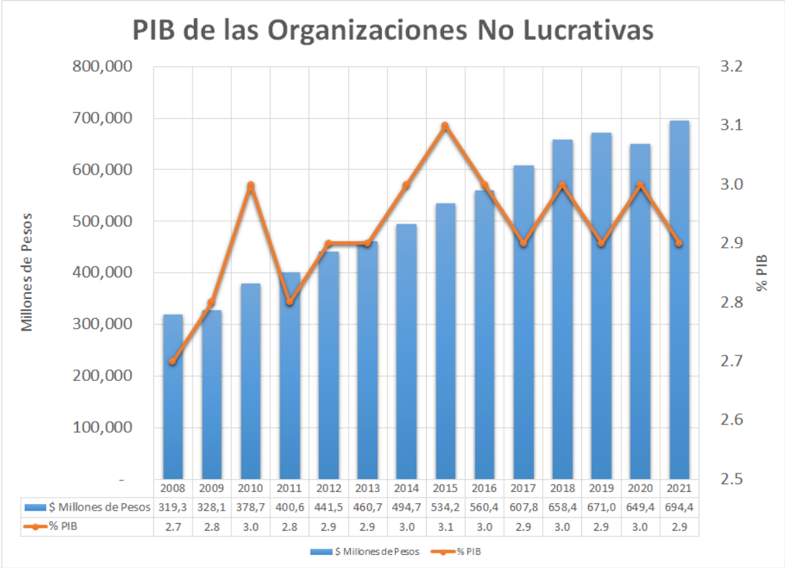
Figura 01 - PIB de las Organizaciones No Lucrativas a través del Tiempo