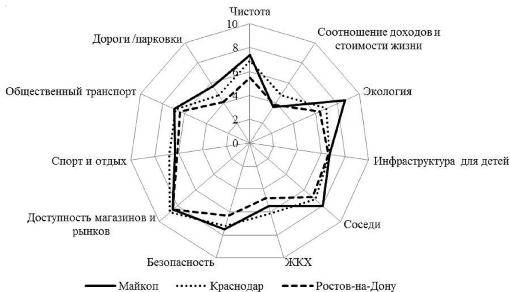
Рис. 2. Рейтинг городов по качеству жизни в 2019 году