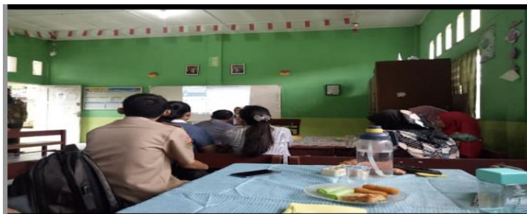
Gambar 2 Pemberian Materi Pelatihan Pemanfaatan Media Pembelajaran Berbasis Flipbook

Dari pelaksanaan kegiatan pelatihan yang telah dilakukan guru-guru mendapatkan pengetahuan dan pengalaman baru dalam memanfaatkan media pembelajaran berbasis flipbook . Dengan selesainya pelatihan pemanfaatan media pembelajaran berbasis flipbook diketahui bahwa memanfaatkan media pembelajaran berbasis flipbook sangat mudah dibuat