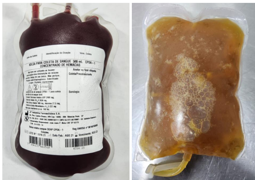
Figura 1. A. Bolsa de sangue total equino acondicionada com citrato fosfato dextrose adenina (CPDA-1). B. Bolsa de plasma fresco congelado equino.