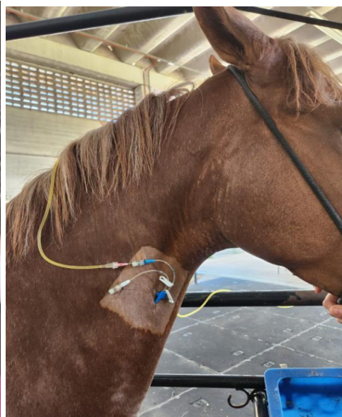
Figura 6. Equino recebendo transfusão de plasma.