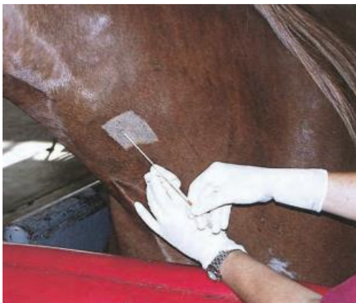
Figura 5. Aplicação do cateter 14 G em direção oposta do fluxo do sangue (cateter direcionado para cabeça) para coleta de sangue destinado à transfusão sanguínea em equinos. Fonte: Slovits & Murray (2001) .

Antes da transfusão, é importante avaliar e registrar os parâmetros clínicos do receptor para verificar a ocorrência de reações transfusionais. Nos primeiros 15-30 minutos, a taxa de transfusão não deve ultrapassar 1 mL/kg/h de sangue transfundido, monitorando-se constantemente os parâmetros clínicos durante a transfusão. Não sendo detectadas reações à transfusão, pode-se elevar a taxa para até 15-20 mL/kg/h, devendo a transfusão ser concluída em até 4 horas, diminuindo possível contaminação e crescimento bacteriano ( Mudge & Williams, 2016 ).