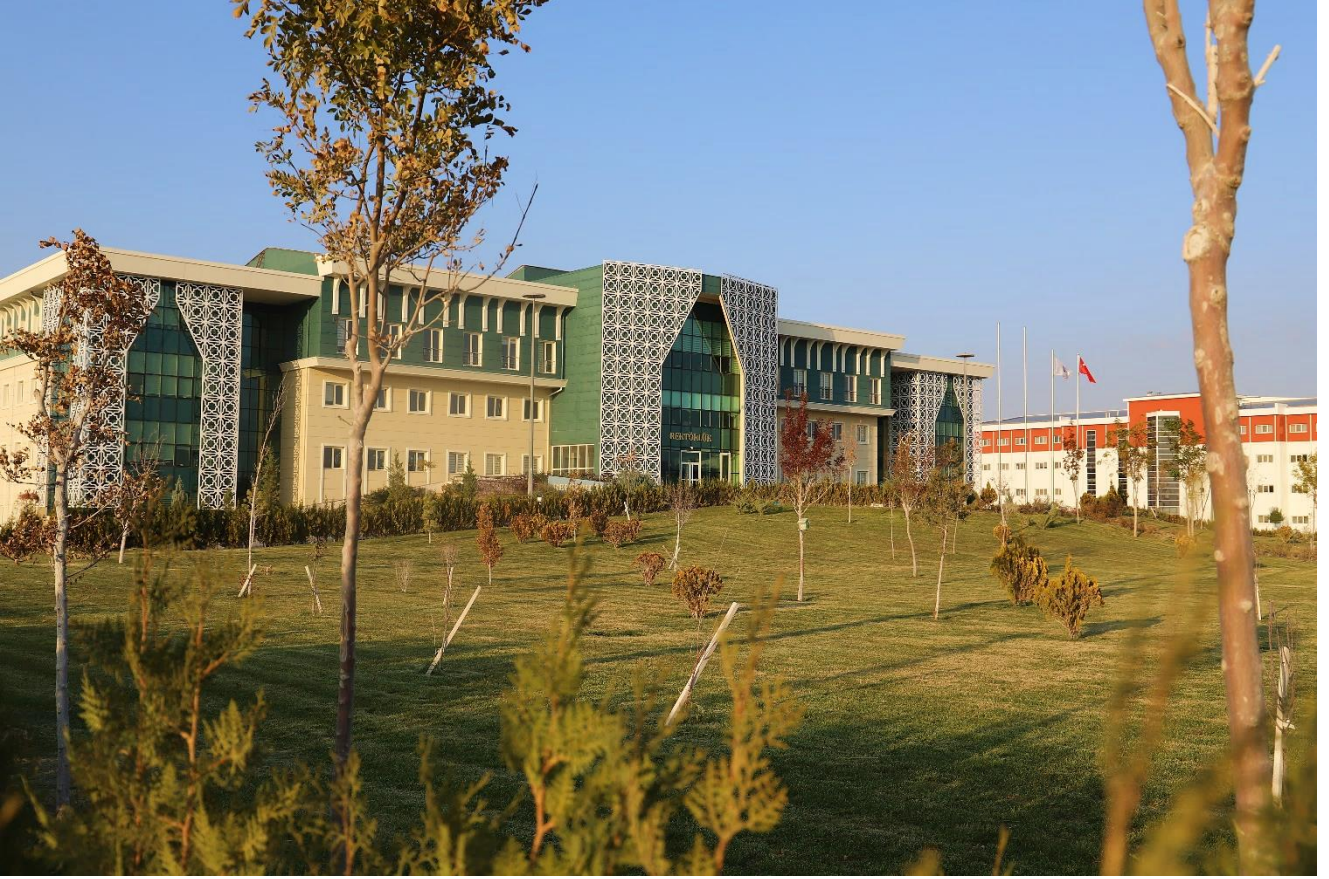
ASÜ-Kampus (Bahar-Güz: 2020)