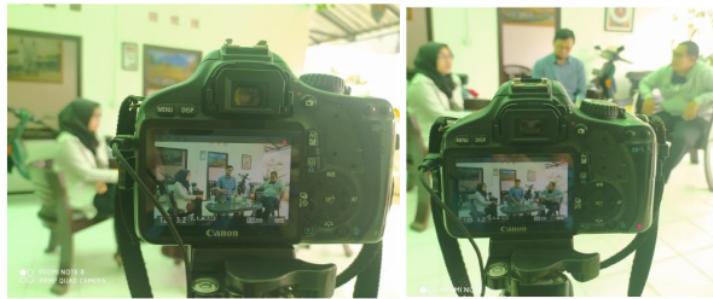
Gambar 1. Proses Pembuatan Konten Podcast

Pemahaman yang baik akan mencegah persebaran hoax (Rosyida, Kusumaningrum and Anggraheni, 2020), sehingga civitas akademika memiliki kemampuan memverifikasi kebenaran berita. Tujuan pembuatan konten podcast adalah untuk mensosialisasikan informasi yang benar terkait keberadaan vaksin dan vaksinasi, agar masyarakat memiliki tingkat kepercayaan, yang nantinya akan menyukseskan keberhasilan vaksinasi COVID-19 di Indonesia. Materi yang menjadi bahan podcast adalah Frequently Asked Question (FAQ), meliputi 1) pengertian vaksin dan vaksinasi, 2) bahan utama vaksin, 3) tingkat keamanan vaksin, 4) jenis dan ragam vaksin COVID-19, 5) efikasi vaksin dan pengaruhnya, 6) kelompok prioritas dalam vaksinasi, serta 7) stigma positif untuk menanggapi vaksin COVID-19.