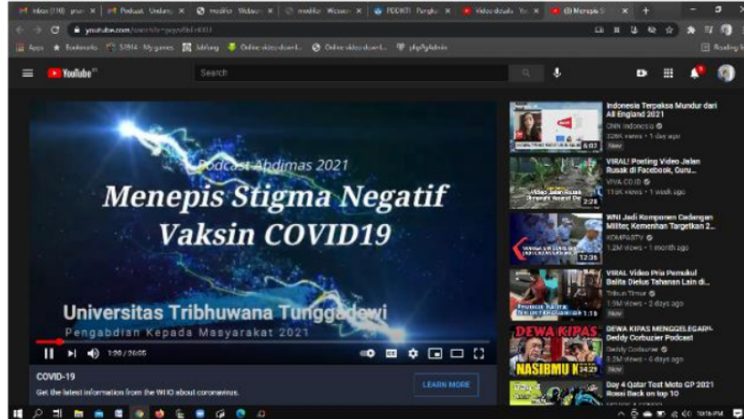
Gambar 2. Konten Podcast yang Diunggah di Youtube