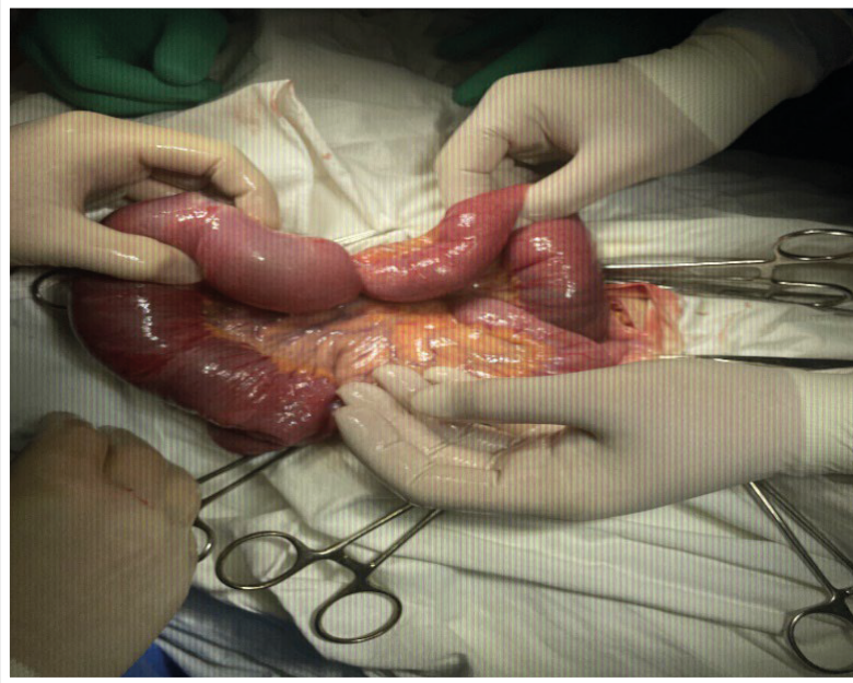
Рис. 1. Інтраопераційний вигляд тонко-тонкокишкової інвагінації.