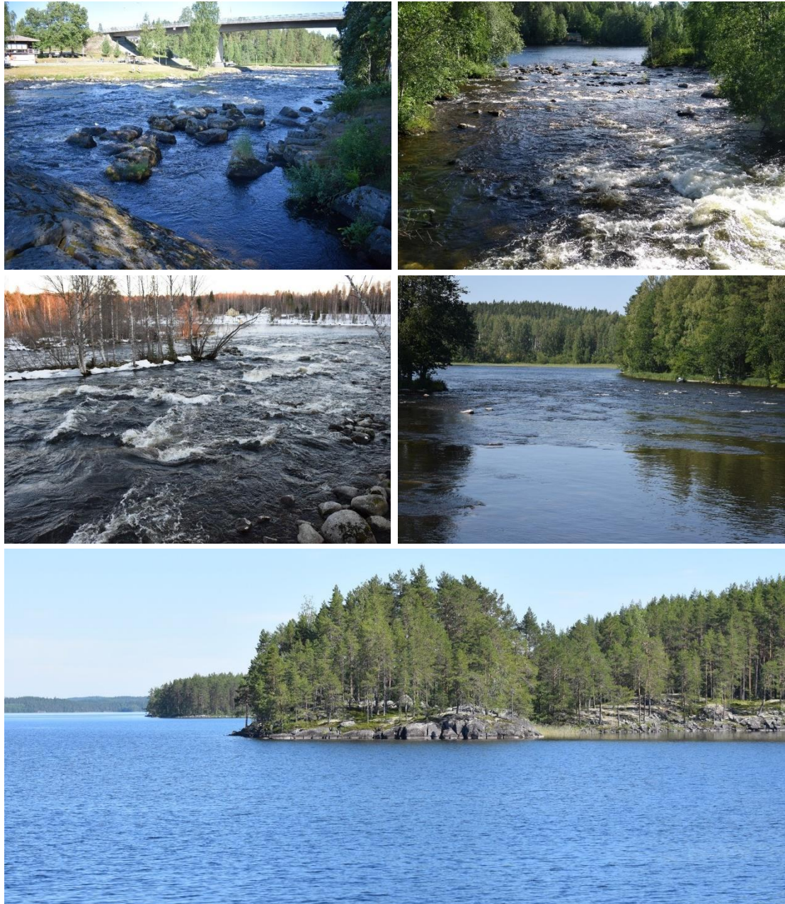
Kuva 1. Vesistöt, joissa tehtiin taimenten ja järvilohien merkintöjä. Karvionkoski, Haapakoski, Kermankoski, Pilpankoski ja Kermajärvi. Virtaussuunta koskissa etualalta taka-alalle päin.