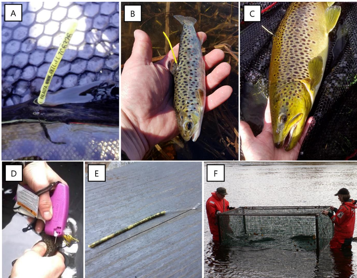
Kuva 2. Merkintämenetelmä (a-d). Tummunut kalamerkki (e). Emokaloja Kermankoskella (f). Kuvien kalat taimenia.

Merkkihavainto- tai merkkipalautusmenetelmässä on joitakin virhelähteitä. Joitakin merkkejä irtoaa kaloista jo jokivaiheen aikana (kirjoittajat, julkaisematon havainto) ja mahdollisesti myös järvivaelluksella. Taimenen kutupesälaskennoissa (Syrjänen ym. 2013) kutupesän pinnalta löytyi Joutsan Rutajoella kaksi taimenista irronnutta Carlin-merkkiä ja Muuramen Muuramenjoella yksi. Nämä irtosivat mahdollisesti kututapahtuman aikana. Tämän lisäksi kalastajat eivät todennäköisesti havaitse kaikkia merkkejä saaliskaloissaan sekä jättävät osan merkkihavainnoistaan kokonaan ilmoittamatta. Merkin pinnoille kasvaa vähitellen leväkerros, jolloin merkki tummuu muuttuen vaikeasti havaittavaksi ja luettavaksi (Kuva 2 e). Valkeajärvi (1993) arvioi, että Konnevedeen ja Päijänteeseen istutetuista Carlin-merkillä merkityistä ja pyydystetyistä taimenista saatiin merkkipalautus vain 28 ja 20 %:n osuudesta saaliskaloista. Toisin sanoen kalastajat jättivät 72–80 % saamistaan merkeistä palauttamatta tämän arvion mukaan.