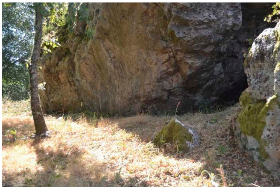
Figuras 3 e 4. Vista xeral do Penedo Gordo.