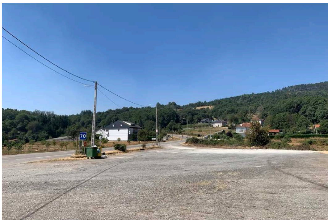
Figuras 5 e 6. Camiños actuais nas inmediacións do Penedo Gordo.