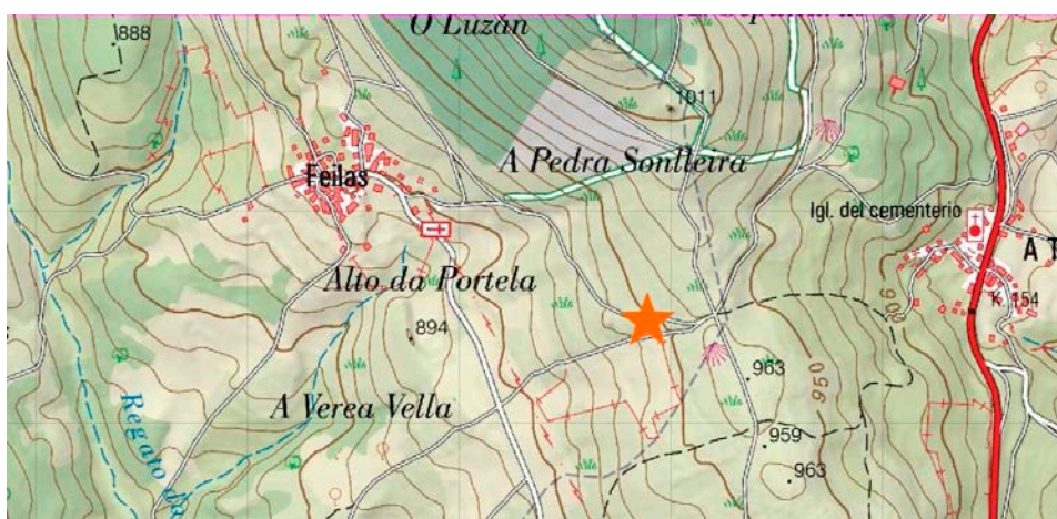
Figura 1. Localización de Feilas e do Penedo Gordo. Fonte: Instituto Xeográfico Nacional 2

O Penedo Gordo está situado nun territorio que ten experimentado fondas transformacións sociais ao longo do Holoceno. Xa hai constancia dunha continua presenza humana, como fan as propias pinturas, ata os nosos días. Aínda que na actualidade a presenza humana é menor por mor do despoboamento, o impacto da actividade humana no medio segue a transformar ese territorio (abertura de pistas, lumes forestais, agresións contra o patrimonio, etc.). O Penedo Gordo atópase dentro do tramo municipal de Vilardevós, entre as poboacións de Feilas (Vilardevós), A Trepa (Riós) e Fumaces (Riós). A poboación máis próxima é a da Trepa (800 m). O penedo pódese ver desde a aldea de Feilas dirección sueste, sempre e cando o sol non se reflecta na aba do monte da Pedra Sonlleira. Un lugar inevitable, xa que corresponde ao camiño de entrada desde o eixe principal da Gudiña a Verín (a estrada nacional N-525, hoxe próxima á autovía A-52), co que a súa presenza debeu de ser constante xa nas antigas vías de comunicación, como se reflicte na cartografía histórica. 1