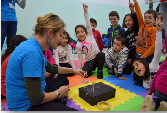
Figura 5 Costruiamo la costellazione di Orione. Oliena 2017

È la fase più ludica, dove i bambini esprimono la loro creatività, le loro potenzialità e competenze, ma è anche la fase in cui i bambini possono comprendere realmente e fissare concetti e/o fenomeni fisici. Per esempio, il passaggio dalla rappresentazione su foglio alla costruzione del modello tridimensionale permette di interiorizzare il concetto che le stelle di una costellazione apparentemente sembrano essere complanari, ma nella realtà possono essere a distanze molto diverse tra loro dalla Terra. Quella che apparentemente sembra essere una relazione spaziale, in