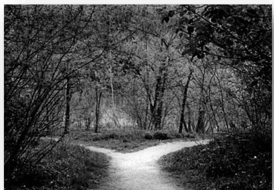
Figura 3 Dove sarà il nord? Strada a destra o a sinistra?

"rientrando, quando trovate il bivio, prendete la strada che va a Nord".