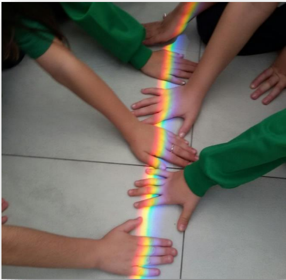
Figura 1 Giocare con la luce

Da svariati anni il settore Divulgazione e Didattica (D&D) dell'INAF-OAC dedica particolare attenzione alla progettazione e realizzazione di laboratori divulgativi sull'astronomia, destinati a bambini molto piccoli (nella fascia d'età prescolare 4-6 anni), bambini della scuola primaria (6-10 anni) e per i ragazzi della scuola secondaria