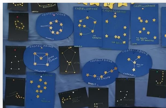
Figura 4 Costellazioni reali e inventate

La fase laboratoriale. I bambini costruiscono dapprima modelli 2d di costellazioni reali e/o completamente inventate, usando il gioco dell'" unisci i puntini " o usando stelline colorate (anche fluorescenti) da attaccare con la colla ad un cartoncino azzurro o blu scuro (Figura 4).