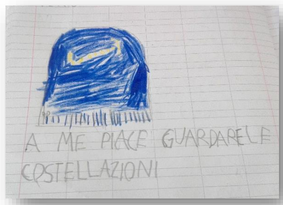
Figura 6 "A me piace guardare le costellazioni" (Costellazione dello Scorpione; cit. Lorenzo)

(Leonardo, 7 anni, commentando i miti legati alle costellazioni)