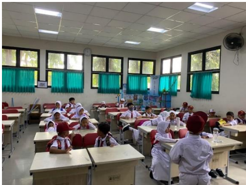
Gambar 1. Kegiatan Literasi di SD Negeri Bojong 03 Kunciran Indah