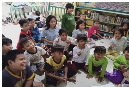
Gambar 4 kegiatan di Taman Baca Kunciran Indah

pengurus kepemudaan Taman Baca serta diteruskan oleh pihak SD Negeri Bojong 03 karena terdapat suatu bangunan semacam taman membaca buku untuk siswa sehingga kegiatan literasi ini tidak terputus dan dapat berjalan seterusnya.