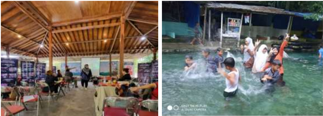
Gambar 2. Lokasi BUMNag Anyer Lestari

Tim pengabdian melakukan observasi ke lapangan untuk melihat jenis kegiatan dari BUMNag Anyer Lestari. BUMNag Anyer Lestari adalah bergerak di bidang usaha wisata air. Beberapa jenis fasilitas yang terdapat di BUMNag tersebut adalah permandian, kuliner, permainan wahana air seperti sepeda air, penjualan ikan hias, balai pertemuan, kuliner. Pada tahap observasi ini Tim Pengabdian dan Mitra Dampingan yaitu BUMNag Anyer Lestari menetapkan jadwal kegiatan.