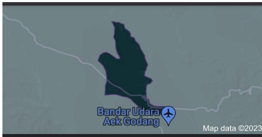
Gambar 1. Peta Desa Aek Godang

Pendidikan merupakan usaha yang tujuh dalam membangun kemampuan intelektual sekaligus kepribadian anak supaya menjadi lebih baik (Amelia, 2021). Pelaksanaan kegiatan pendidikan sebagian besar telah dilakukan dalam sekolah formal, namun tidak selamanya pendidikan di sekolah formal berjalan lancar dan memberikan hasil sesuai dengan yang diharapkan. Ada sebagian anak terkadang mengalami hambatan dan kesulitan dalam belajar, seperti hambatan berprestasi dan kurangnya motivasi untuk belajar (Febriyanti, 2017). Hal ini nampak dari sebagian anak menunjukkan hasil prestasi yang kurang maksimal dan semangat motivasi untuk belajar masih kurang serta kecenderungan waktu yang digunakan untuk bermain lebih dominan daripada untuk belajar (Sueca, 2020).