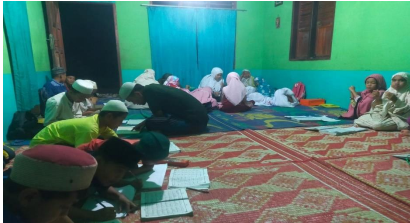
Gambar 2. Bimbingan belajar baca al-quran