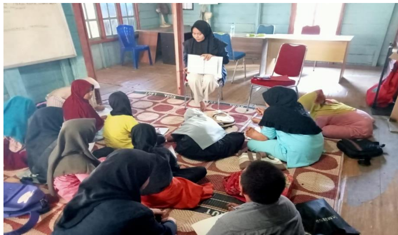
Gambar 3. Bimbingan belajar membaca, menulis dan berhitung