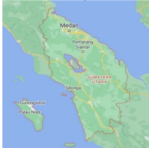
Gambar 1. Peta Provinsi Sumatra Utara

Jembatan Nasional yang terletak di Sumatra Utara harus diperhatikan dikarenakan jalur ini merupakan Jalur Lintas Timur Sumatra yang sangat vital. Adapun pengumpulan data jembatan mengacu pada Bridge Management System (BMS) untuk menentukan nilai kondisi jembatan.