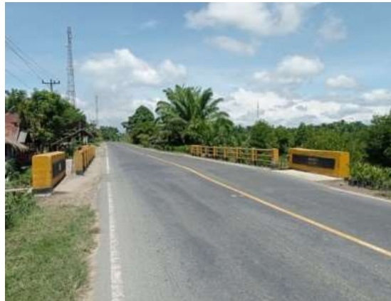
Gambar 2. Tampak Depan Masuk Jembatan Sei Sekundur Kecil II