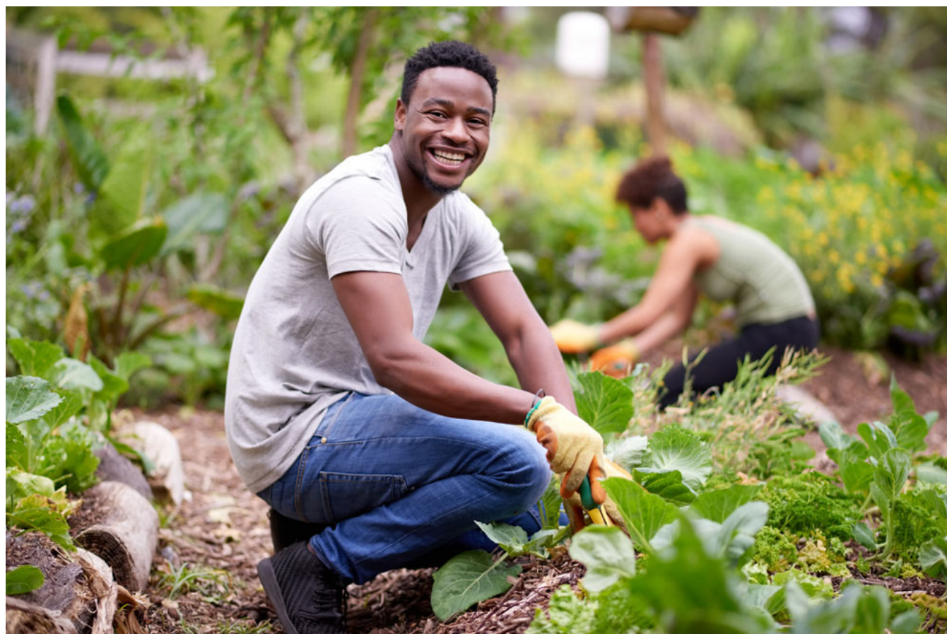
Flüchtlinge packen in der Landwirtschaft an