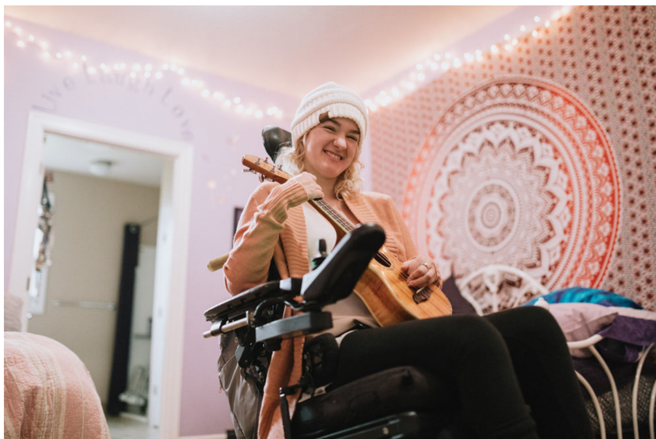
Selbstbestimmtes Wohnen für Menschen mit Behinderungen