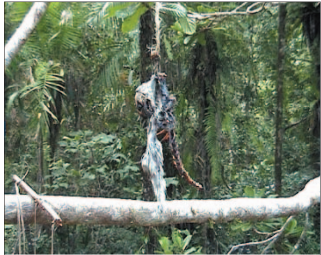
FIGURE 2. Cheirogaleus ravus oublié par le chasseur et dévoré par le Fosa ou Cryptoprocta ferox

L'intervention de l'éducation environnementale est indispensable dans le 'fokontany' d'Andongona et le village d'Anantaka pour sensibiliser les COBA et les populations sur l'importance et l'avantage des ressources forestières, pour qu'ils ne défrichent plus la forêt mais de restaurer plutôt les forêts détruites par les pratiques de cultures sur brûlis et l'installation des pièges à lémuriens. Les appuis techniques seront indispensables pour les associations à élaborer un plan de développement tenant compte de la nécessité de fournir à ses membres des services de qualité, de développer sa viabilité financière. L'application de politiques économiques relatives à satisfaire les besoins quotidiens de chaque membre de l'association est primordiale, c'est-à-dire faire un aménagement de terroir pour permettre les cultures vivrières et d'instaurer l'équilibre des circuits de production et de consommation dans un système économique adéquat. Ce système nécessite la création des conditions améliorant l'offre viable en produits et en services financiers, dans les zones rurales. Donc, ce système nécessite la création d'un projet qui assurera