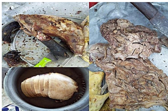
Figura 2. Piezas de especies comercializadas en el mercado urbano de Plato, Magdalena: a) hikota ( Trachemys callirostris ); b) ponche ahumado ( Hydrochoerus isthmius ); c) posta de armadillo ( Dasyus novemcinctus ).

Las especies de fauna silvestre utilizadas en el comercio local de Plato corresponden al 71 % de lo reportado previamente para el departamento del Magdalena por Quiceno et al. (2015). Además, si bien en este estudio no se cuantificaron los kilogramos de carne de monte que se comercializan, se logró percibir que los mamíferos son una importante alternativa de proteína animal en el casco urbano. Esta es una situación similar a la observada por Quiceno et al. (2015), Gómez et al. (2016b) y Van Vliet et al. (2016) en diferentes zonas del país, donde las especies de este grupo taxonómico son objeto de intenso comercio debido a que son consideradas por las comunidades como un producto de buen sabor, limpio y de excelente calidad (Gómez-Herrera et al. , 2023).