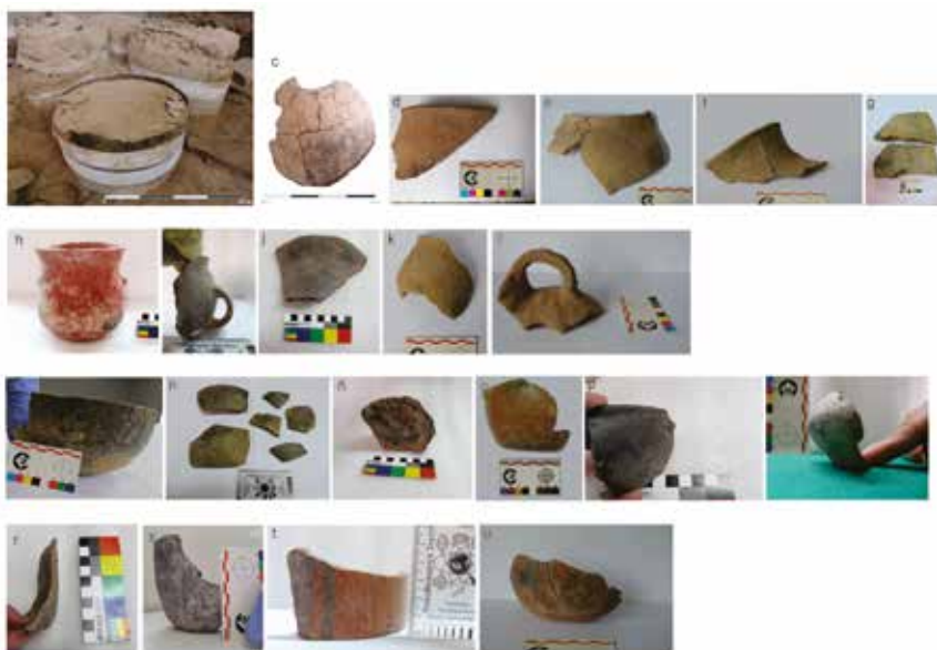
Figura 2. Piezas semicompletas, familias de fragmentos y perfiles diagnósticos para la identificación de formas y dimensiones de recipientes cerámicos.

Un estudio previo, realizado por otros investigadores sobre el material cerámico del período Formativo en el área, reveló una primera caracterización de la alfarería con una presencia predominante de grandes ollas tubulares y sin cuello que alcanzaron el metro de altura, pucos, tazas y tazones altos hemisféricos o elipsoides, llamados usualmente “vasos” en la bibliografía (Madrado, 1969; Menacho y González, 2005). De nuestros estudios más recientes se desprende una ampliación del repertorio conocido y avanzamos en el reconocimiento de nuevas siluetas y, en consecuencia, nuevas funciones asociadas a cada caso (Juarez et al. , 2020) (figura 2).