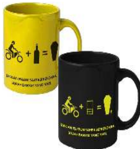
Gambar 9. Desain Mug

JANGAN MABUK SAAT BERKENDARA. SUDAH BANYAK YANG MATI. JANGAN BERKENDARA SAMBIL TELEPON. SUDAH BANYAK YANG MATI. SAVE DRIVE MOTORCYCLE. STAY ALIVE TOGETHER.