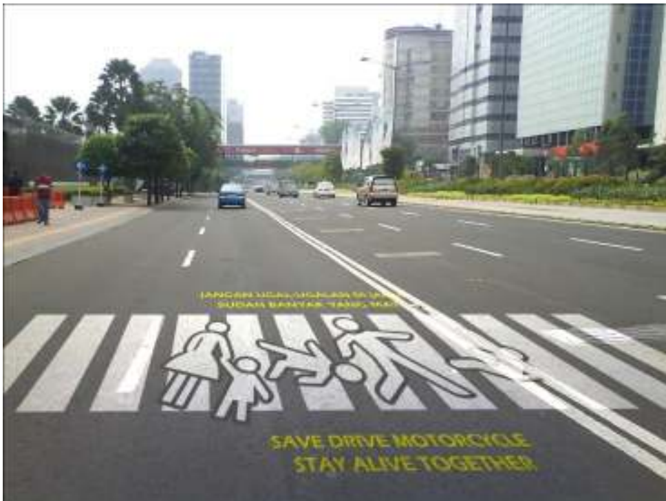
Gambar 4. Penempatan Zebra Cross