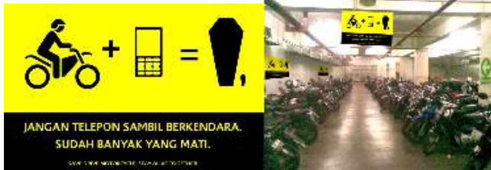
Gambar 5. Desain Poster (Kiri), Penempatan Poster (Kanan)