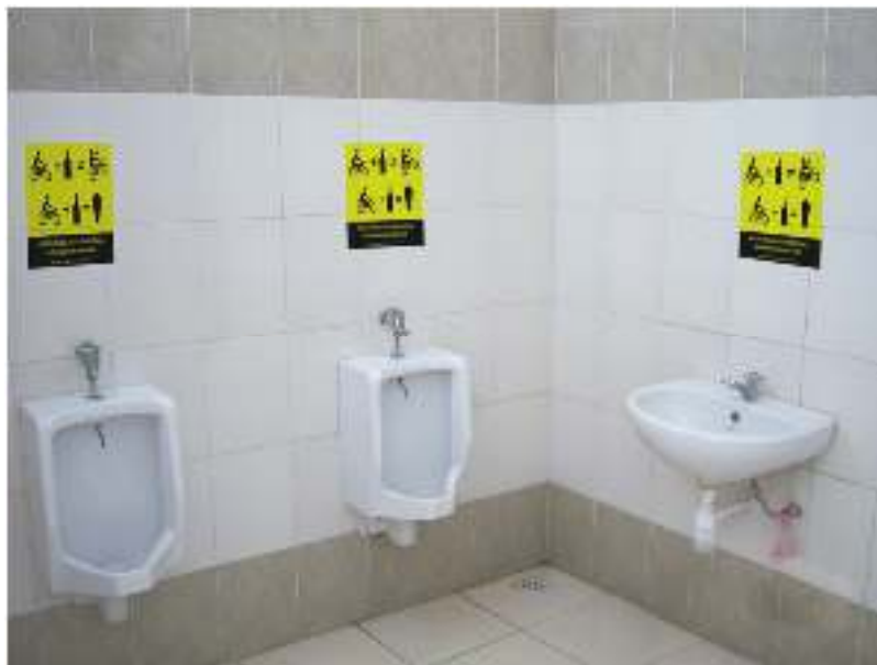
Gambar 7. Penempatan Poster Area Toilet

Poster larangan mabuk saat berkendara ini untuk mengingatkan target audiens bahwa telah banyak korban karena mereka berkendara dalam kondisi mabuk/tidak sadar akibat pengaruh alkohol atau narkoba.