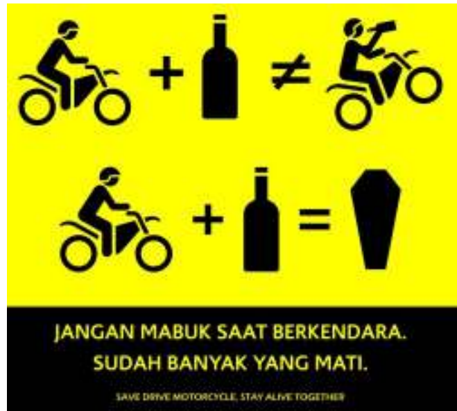
Gambar 6. Desain Poster Area Toilet