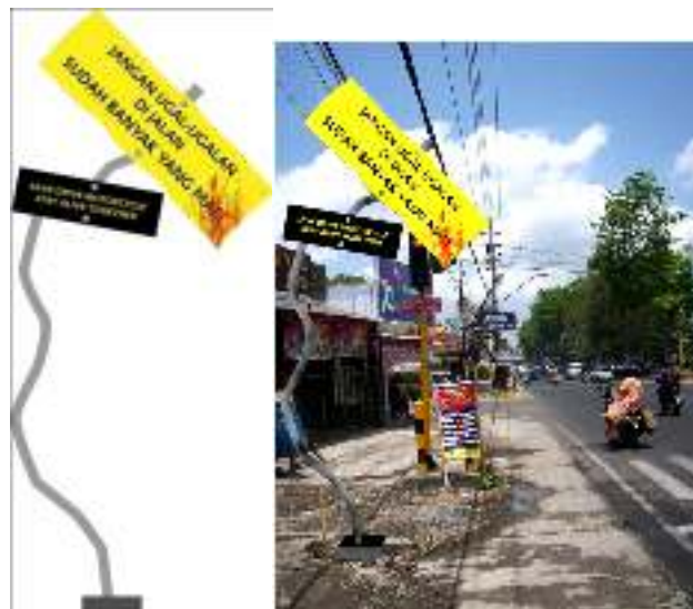
Gambar 2. Desain Sign Board Rusak (Kiri), Penempatan Sign Board Rusak (Kanan)