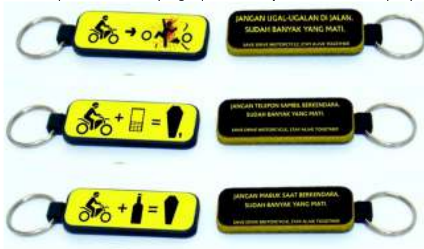
Gambar 8. Desain Gantungan Kunci

Gantungan kunci merupakan media yang efektif untuk menyampaikan pesan dan pengingat kampanye karena hampir tiap hari menyertai target audiens. Gantungan kunci adalah point of contact yang tepat untuk dijadikan media kampanye.