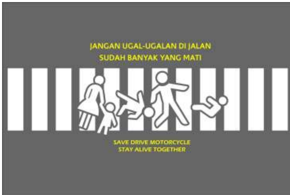
Gambar 3. Desain Zebra Cross