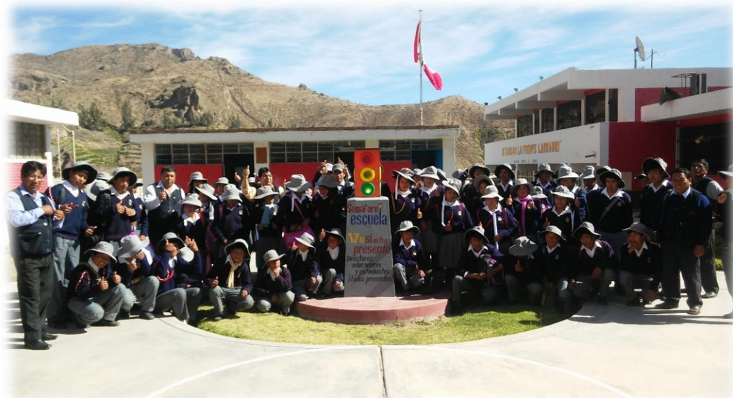
Comunidad Educativa después de Jornada de Convivencia