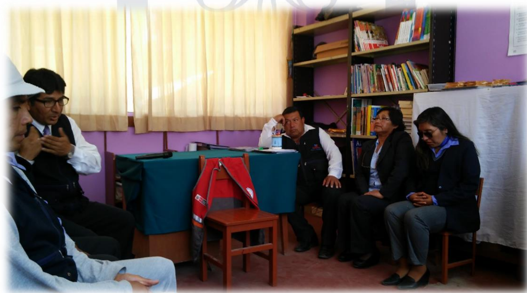
Jornada de Reflexión Pedagógica sobre resultados en el área de comunicación.