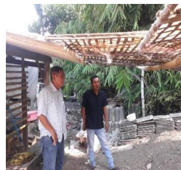
Gambar 4. Kegiatan Monitoring Tim Pengabdian

pertumbuhan penjualan produk samiler setiap bulannya dan penggunaan digital marketing melalui instagram. Hasil monitoring yang dilakukan digunakan sebagai dasar tim untuk menentukan tingkat ketercapaian dari program, hasil yang dicapai dari kegiatan ini adalah ketercapaian dari program yang diusulkan. Keberhasilan program ini ditunjukkan dengan adanya peningkatan penjualan produk kerupuk samiler.