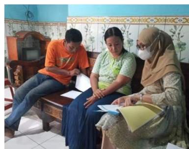
Gambar 2. Sosialisasi dan Pelatihan Literasi Keuangan

Tim pengabdian memberikan sosialisasi mengenai literasi keuangan dan manfaat yang diperoleh pemilik usaha apabila melakukan pencatatan keuangan. Setelah melakukan sosialisasi, selanjutnya tim melakukan pelatihan mengenai penyusunan laporan keuangan sederhana meliputi laporan arus kas, laporan laba rugi dan laporan posisi keuangan. Hasil yang dicapai adalah mitra telah menyusun laporan keuangan secara rutin sehingga dapat membantu pemilik usaha untuk mengevaluasi pertumbuhan usahanya dan dapat digunakan sebagai salah satu persyaratan pinjaman modal usaha di perbankan. Ketercapaian hasil berikutnya adalah mitra telah memahami pengelolaan keuangan, perencanaan keuangan dan kinerja laporan keuangan.