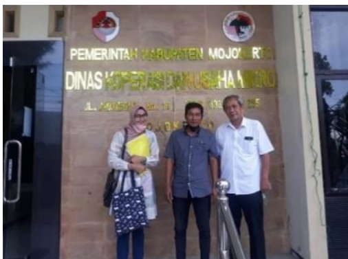
Gambar 3. Pendampingan Perijinan Usaha di Dinas Koperasi dan UMKM Mojokerto

Pendaftaran legalitas usaha ini melibatkan peran serta aktif dari mitra, mitra melakukan pendaftaran perijinan usaha secara online maupun offline melalui Dinas Koperasi dan UMKM, Dinas Kesehatan Mojokerto dan Labkesda Mojokerto dengan didampingi oleh tim pengabdian. Hasil yang telah dicapai untuk legalitas usaha adalah mitra telah memiliki Nomor Induk Berusaha (NIB), Produk Industri Rumah Tangga (PIRT) dan halal.