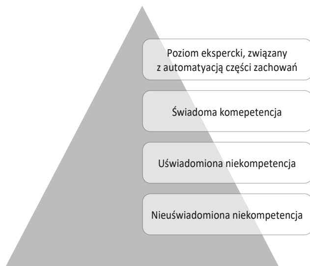
Schemat nr 2: Piramida kompetencji: (nie)uświadomiona (nie)kompetencja vs poziom ekspercki

Proponowane metody badawcze są nie tylko dostosowane do możliwości poznawczych i społecznych dziecka oraz jego kompetencji językowo-komunikacyjnych, ale także pozwalają zweryfikować poziom deklaracyjny w stosunku do rzeczywistych umiejętności medialnych widocznych w konkretnych działaniach. W efekcie możliwe jest oznaczenie poziomu i zakresu poszczególnych kompetencji z wykorzystaniem schematu nr 2.