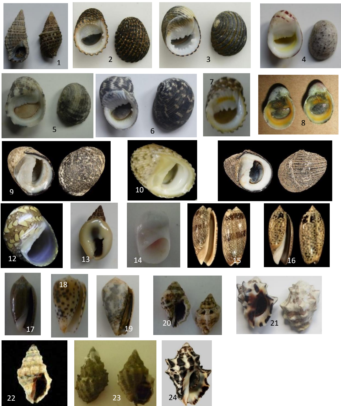
Keterangan Gambar: 1) Clypeomorus battilaeriformis ; 2) Nerita exuvia ; 3) Nerita costata ; 4) Nerita polita ; 5) Nerita chamaeleon ; 6) Nerita undata ; 7) Nerita signata ; 8) Nerita patula ; 9) Nerita ocellata ; 10) Nerita insculpta ; 11) Nerita planospira ; 12) Clithon oualaniensis ; 13) Nassarius pullus ; 14) Polinices mammilae ; 15) Olivia sericea ; 16) Olivia samarensis ; 17) Oliva oliva ; 18) Conus pulicarius ; 19) Conus coronatus ; 20) Oppomorus funiculatus ; 21) Tylothais aculeata ; 22) Semiricinula fusca ; 23) Nassarius niger ; 24) Reisha bitubercularis