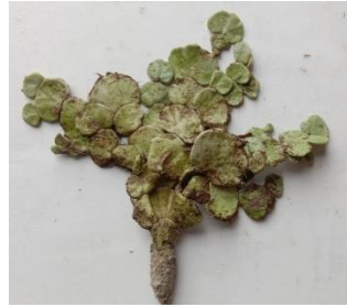
Gambar 4. Halimeda macroloba Decaisne