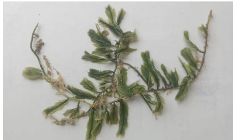
Gambar 3. Caulerpa sertularioides S.G. Gmelin (Gambar 3)

Distribusi di Sulawesi Tenggara : Perairan Teluk Kendari dan sekitarnya (Handayani, 2021).