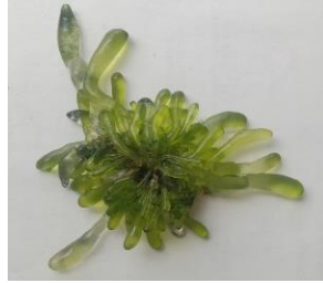
Gambar 2. Boergesenia forbesii (Harvey) J. Feldmann, 1938

Distribusi di Sulawesi Tenggara : Pulau Hari Kabupaten Konawe Selatan (Ira, dkk , 2018), perairan desa Mata Kecamatan Kambowa Kabupaten Buton Utara (Ira, 2018), pantai Lakaliba Kabupaten Buton Selatan (Fatimah, dkk , 2021), dan perairan Teluk Kendari dan sekitarnya (Handayani, 2021).