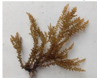
Gambar 9. Acanthopora muscoides (Linnaeus) Bory de Saint-Vincent, 1828

Distribusi di Sulawesi Tenggara : Pulau Hari Kabupaten Konawe Selatan (Ira, dkk , 2018), perairan desa Mata Kecamatan Kambowa Kabupaten Buton Utara (Ira, 2018).