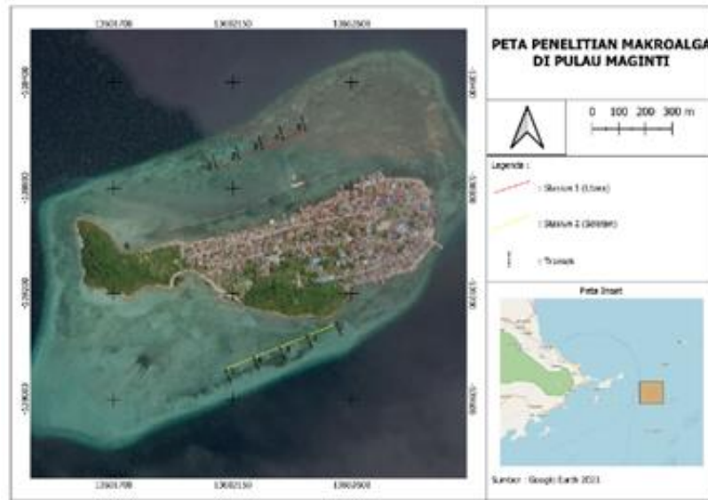
Gambar 1. Peta lokasi penelitian