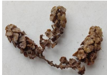
Gambar 8. Turbinaria ornata (Turner) J. Agardh, 1848

Distribusi di Sulawesi Tenggara : Pulau Hari Kabupaten Konawe Selatan (Ira, dkk , 2018), perairan desa Mata Kecamatan Kambowa Kabupaten Buton Utara (Ira, 2018), pantai Lakaliba Kabupaten Buton Selatan (Fatimah, dkk , 2021), dan perairan Teluk Kendari dan sekitarnya (Handayani, 2021).