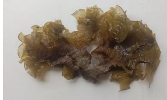
Gambar 7. Padina australis Hauck, 1887

Distribusi di Sulawesi Tenggara : Pulau Hari Kabupaten Konawe Selatan (Ira, dkk , 2018), pantai Lakaliba Kabupaten Buton Selatan (Fatimah, dkk , 2021), dan perairan Teluk Kendari dan sekitarnya (Handayani, 2021).