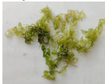
Gambar 6. Ulva reticulata (Forsskål), 1775

Distribusi di Sulawesi Tenggara : Belum dilaporkan