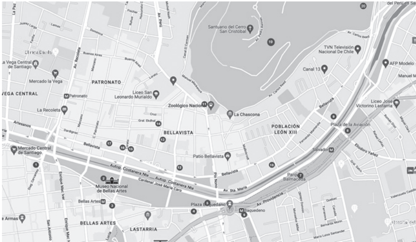
Figura 2. Sitios LGTBIQA+ cercanos al Río Mapocho en Santiago de Chile décadas 90s, 2000s, 2010s, 2020s: 1. Cine Apolo; 2. Museo Bellas Artes; 3. Calle J. M. de la Barra; 4. Disco Queen; 5. Parque Forestal; 6. Plaza Baquedano y Parque Bustamante; 7. Parque Balmaceda; 8. Plaza de la Aviación; 9. Discoteca Fausto; 10. Sauna Sebastián; 11. Discoteca Bokara; 12. Restaurant Capricho Español; 13. Discoteca Bunker; 14. Sauna Mi Tiempo; 15. Restaurant El Toro; 16. Restaurant Sarita Colonia; 17. Sauna 282; 18. Restaurant Sabor a Mí; 19. Parque Metropolitano; 20. Jardín Japonés. Algunos de estos lugares se encuentran hoy cerrados, a causa del estallido social y la posterior pandemia (Fuente: Elaboración Propia).

La Chimba nació desde la fundación de la ciudad con el signo de la exclusión, primero fue lugar de los indígenas, vagabundos, luego de la población más desposeída, y hoy de las minorías raciales y sexuales. Todo ello lo convierte claramente en un territorio liminal, entre la razón, el orden y la racionalidad de la cultura hispana fundacional y, la barbarie y salvajismo del mundo indígena americano. Es esta misma potencialidad de ser un espacio de albergue de todo lo marginal, que ha convertido a la Chimba en el barrio más heterotópico de nuestra capital. Abundan en él, aún hoy, las ruinas de viejos conventos, cementerios, la morgue, hospitales, psiquiátricos, etc. Es decir, el lugar de la enfermedad, lo anormal, de lo irracional, de aquello que está cercano, presente pero a la vez ausente, territorio de la alteridad, en donde surge el “otro negado”, pero necesario para la construcción de las identidades hegemónicas. Esto lo ha convertido en un lugar predilecto de imaginarios literarios y artísticos. Es el territorio de los imbunches de José Donoso, Damiela Eltit y Nona Fernández: “...es la ciudad la que genera sus propios imbunches, posicionándolos en estas zonas limítrofes en que se engendran los desechos” (Vargas, 2018, p. 2269). Un territorio que se nos muestra como laberíntico y rizomático, una característica muy habitual en la espacialidad queer. Este es quizás el único sector, en el hoy denominado barrio