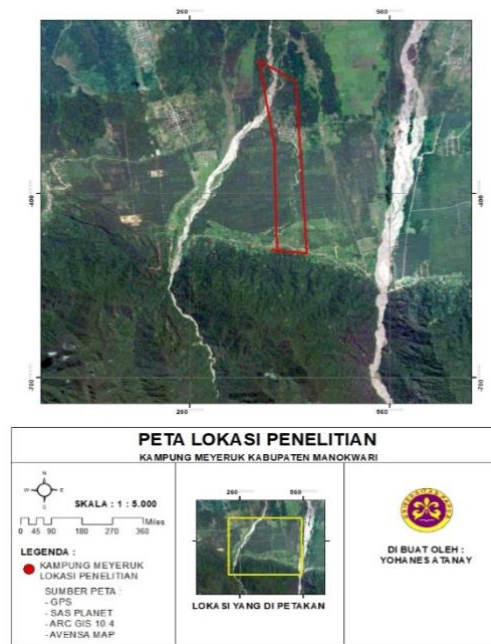
Gambar 1. Peta Lokasi Penelitian Kampung Meyeruk