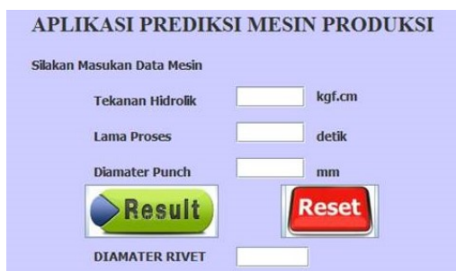
Gambar 3. Implementasi antarmuka

Aplikasi ini dirancang dan dibangun secara sederhana guna mempercepat proses perhitungan prediksi diameter mesin rivet ketika proses produksi, sehingga antarmukanya hanya terdiri dari 1 halaman saja, seperti terlihat pada Gambar 3 ini.