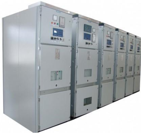
Gambar 2. Switchgear