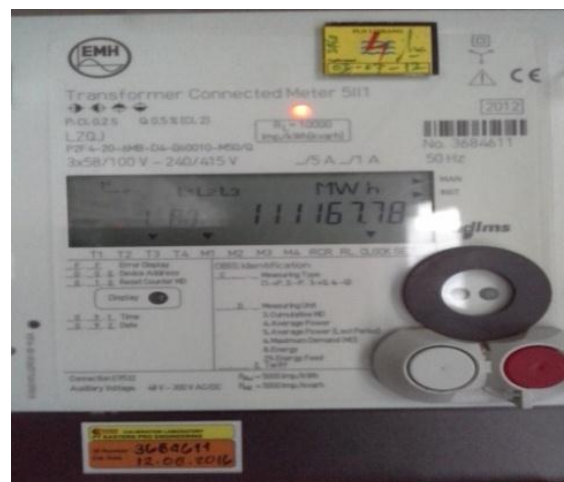
Gambar 3. kWh Meter Outgoing

Sistem monitoring kWh outgoing adalah kegiatan mengamati dan mencatat daya yang telah dikeluarkan ke sistem atau didistribusikan ke jaringan 20 kV. Sistem monitoring dilakukan perjam selama 23 jam. Gambar 3 merupakan contoh kWh meter outgoing yang ada di PLTMG Kijang, pada kWh meter tersebut monitoring pengeluaran daya dilakukan.