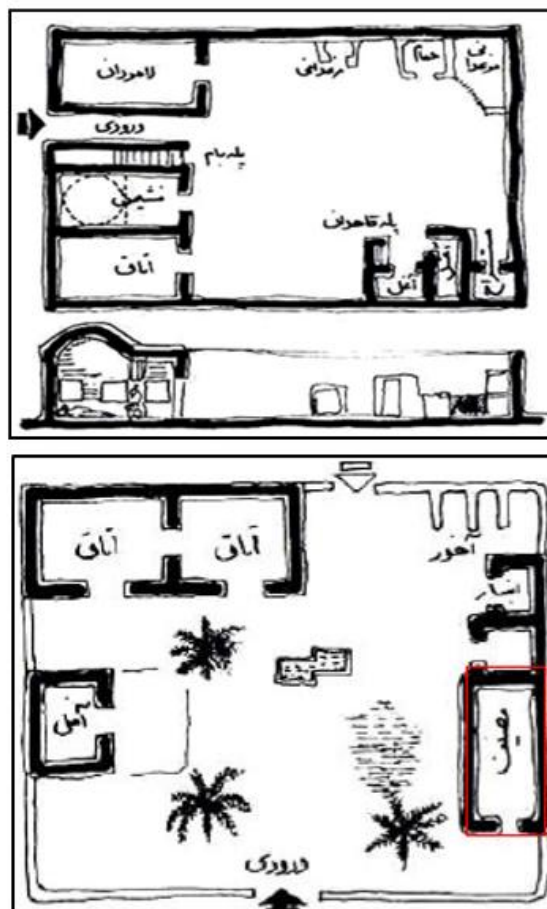
شکل ۲: فضاهای دو نوع مسکن معیشت محور تهیه و ترسیم: نگارندگان، ۱۴۰۰