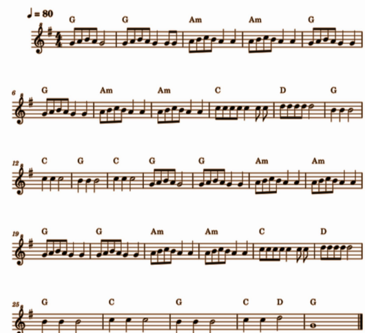
Figura 2: Composição “A Cigarra Sisi”, autoria de Tais Dantas.

Optamos por apresentar composições dos autores do resumo em junção dos direitos autorais dos demais compositores.