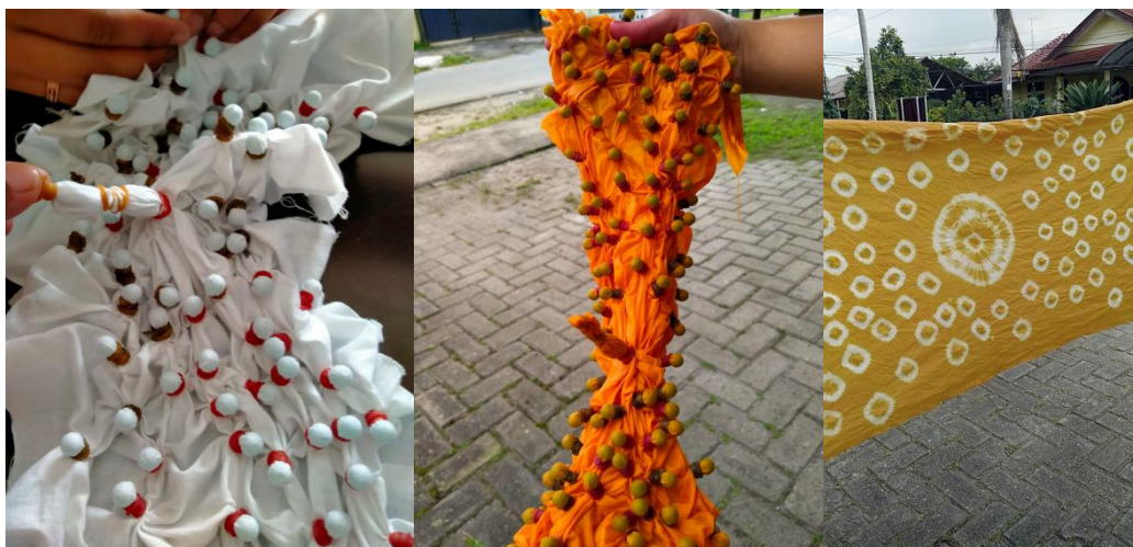
Gambar 3. Proses Pembuatan Kain Bermotif dengan Teknik Celup Ikat Shibori

Setelah pelaksanaan pelatihan, Tim Pengabdian Kembali memberikan paket kain dan pewarna kepada Ibu Nuraisyah yang dapat dimanfaatkan sebagai bahan latihan. Hal ini ditujukan untuk lebih mengasah keterampilan dalam membuat aneka motif kain.