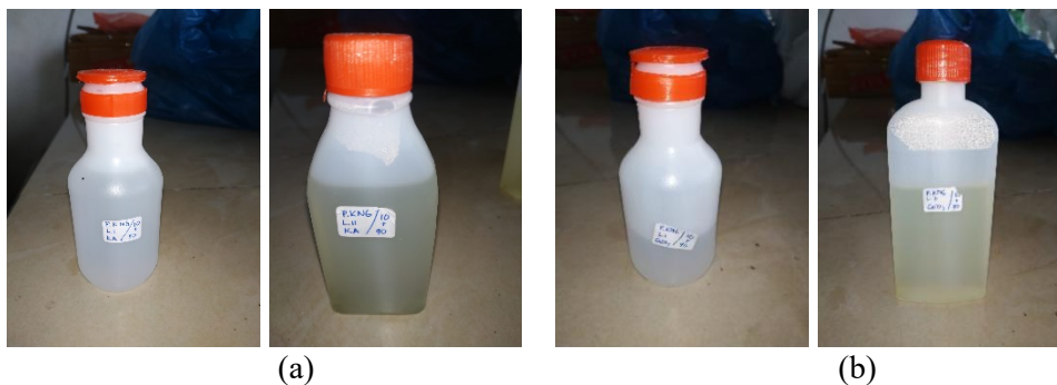
Gambar 5. Pengolahan Limbah Larutan Pewarna (a) Menggunakan Karbon Aktif, (b) Menggunakan \text{CaCO}_3

Hasil uji di laboratorium menunjukkan bahwa limbah larutan sisa pewarna dapat diolah sehingga menghasilkan larutan bening tak berwarna (Gambar 5). Larutan sisa pewarna dan larutan yang telah diolah tersebut dianalisis menggunakan peralatan spektrofotometri UV-Vis di Laboratorium Ekologi di Departemen Teknik Kimia USU. Teknik pengolahan limbah larutan sisa pewarna yang digunakan adalah metode adsorpsi menggunakan adsorben berupa kalsium karbonat dan karbon aktif. Kalsium karbonat merupakan adsorben yang dapat dibuat di rumah menggunakan bahan buangan berupa kulit telur, kulit udang, atau kulit kerang.