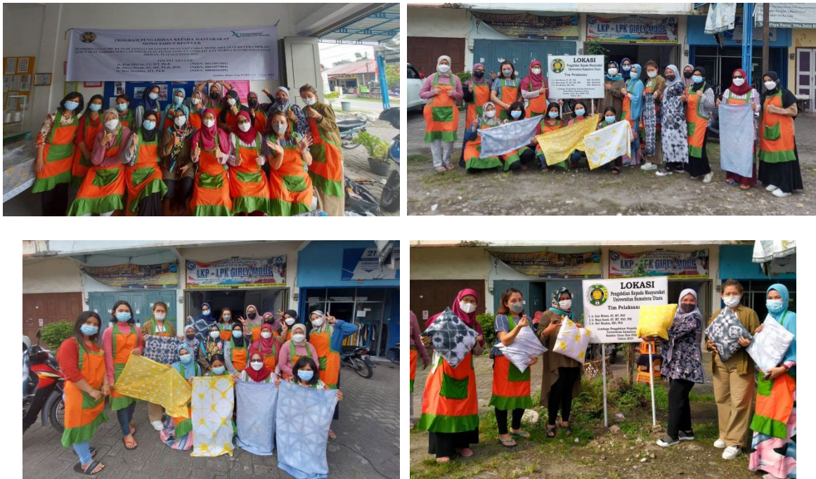
Gambar 2. Tim Pengabdian dan Peserta Memamerkan Hasil Praktikum