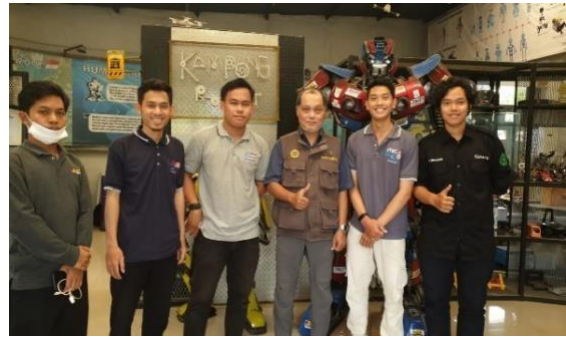
Gambar 10 : kunjungan kepala jurusan teknik elektro Unram untuk monitoring dan evaluasi mahasiswa magang unram di PT.RRI

Gambar diatas merupakan data service atau hasil akhir dari perbaikan sarana yang saya dan tim lakukan. Pada data tersebut memuat informasi-informasi yang berkaitan dengan perbaikan sarana yang telah kami perbaiki. Selain sebagai pengingat dan bahan evaluasi, data diatas akan kami gunakan untuk melakukan monitoring barang yang sudah dikerjakan serta menjadi laporan mingguan tim yang akan kami serahkan kepada direktur perusahaan.