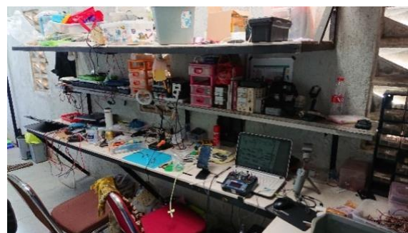
Gambar 2 : Ruang Service Robotik tempat semua kegiatan service dilakukan

Kegiatan utama yang kami lakukan di divisi ini adalah melakukan perbaikan pada sarana mengajar yang mengalami kerusakan. Sarana mengajar yang pernah kami perbaiki antara lain Arduino, NodeMCU, MRT-X, Node, MRT 5, MRT 3, MRTduino, Smartoding dan sarana elektronik lainnya.