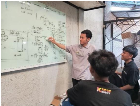
Gambar 5 : Kegiatan mentoring kepada anggota siswa pkl smk padang di ruangan service robotik

Kami juga mengadakan mentoring langsung terkait proses analisa, eksekusi, perbaikan, dan hasil evaluasi terhadap kesulitan yang dialami oleh masing-masing anggota dari tim dalam mengerjakan tugas perbaikan.