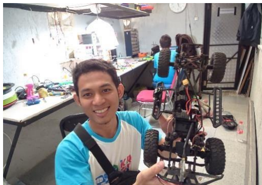
Gambar 6 : salah satu kegiatan membuat project robot ,mengganti kontroler mobil rc dengan arduino

Tujuan dari kegiatan ini adalah untuk meningkatkan kemampuan analisa kerusakan yang dikerjakan oleh tim kami agar dalam penyelesaian perbaikan selanjutnya kami dapat mempercepat penyelesaian masalah yang terjadi. Waktu untuk melaksanakan kegiatan mentoring ini tidak teratur. Kami melaksanakannya dengan melihat hasil evaluasi maupun masalah yang di hadapi.