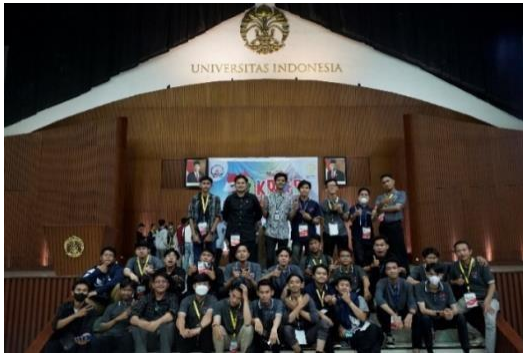
Gambar 8 : Event lomba kontes robot nusantara yang di laksanakan di balairung UI

Oleh karena di PT.Racer Robot Indonesia drone digunakan pada banyak kegiatan, maka tidak sedikit pula drone yang mengalami kerusakan akibat kesalahan pemakaian. Utamanya yang dilakukan oleh peserta lomba yang kurang memahami terkait cara pengoperasian drone yang baik dan benar.