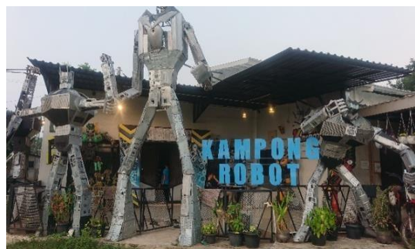
Gambar 1 : Kantor Kampong Robot tempat mbkm magang berlangsung

Kegiatan magang di laksanakan dalam sebuah kantor yaitu Kampong Robot yang beralamatkan di Jl. Vila Dago Tol Blok B1 No.6, RT.009/RW.19, Serua, Kec. Ciputat, Kota Tangerang Selatan, Banten 15414. Mahasiswa yang melaksanakan magang di PT.Racer Robot Indonesia pun tidak hanya berasal dari satu atau dua Perguruan Tinggi, melainkan ada banyak lagi Perguruan Tinggi yang tersebar di banyak daerah di Indonesia.