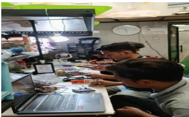
Gambar 3 : kegiatan perbaikan sarana robotik di ruangan service robotik

Seperti yang disajikan pada gambar di atas, ini merupakan ruangan khusus untuk melakukan aktivitas service atau perbaikan sarana robotik di PT.Racer Robot Indonesia. Di ruangan inilah saya dan tim melakukan segala bentuk aktivitas yang berhubungan dengan divisi RTC, seperti perbaikan sarana robotik, mentoring, training, dan pembuatan project-project robotik lainnya yang ditugaskan kepada kami.