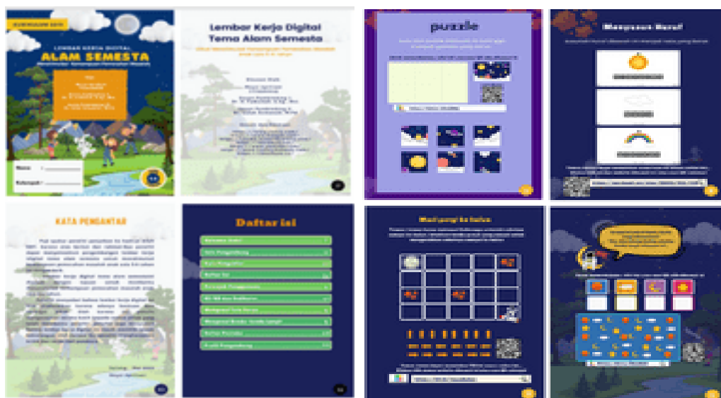
Gambar 3. Pengembangan Lembar Kerja Digital

Development atau pengembangan dilakukan peneliti untuk memvalidasi produk lembar kerja digital yang telah dibuat kepada ahli materi, ahli media dan praktisi lapangan yang kemudian hasil evaluasi dan perbaikan dari dari validasi tersebut digunakan untuk uji coba kelompok kecil.