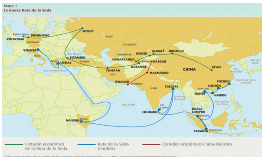
Ilustración 1. La nueva Ruta de la Seda.