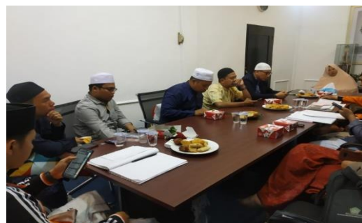
Gambar 3: Pendampingan Penyusunan Pedoman Penulisan Risalah Ilmiah

Melalui pendampingan tersebut, diharapkan dapat menghasilkan pedoman penulisan risalah ilmiah yang dapat digunakan oleh setiap mahasantri yang akan menyelesaikan studinya. Pendampingan tersebut melibatkan dosen pengajar Ma'had Aly Syekh Ibrahim Al-Jambi.