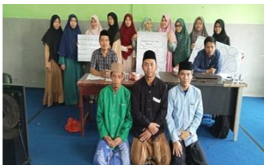
Gambar 1 : FGD Analisis Masalah dan Harapan Mahasantri