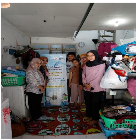
Gambar 5 : Foto Bersama Peserta Kegiatan PKM