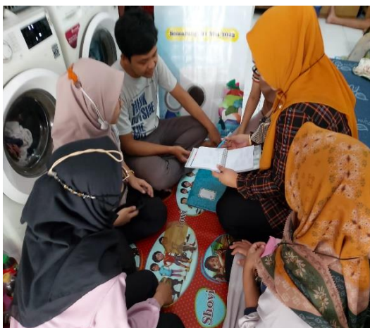
Gambar 4 : Pelaksanaan Kegiatan Pelatihan Tata Kelola Keuangan