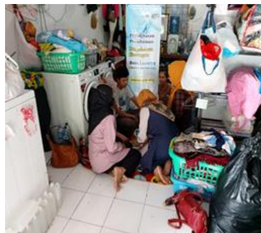
Gambar 3 : Pelaksanaan Kegiatan Edukasi Pentingnya Pembukuan