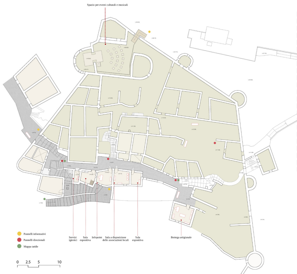
Fig. 11 - Pianta di progetto dei piani terra (elaborazione grafica di M. P. Testa)

Ricomporre una rovina (Ugolini, 2010) implica una conoscenza accurata, che è possibile raggiungere solo attraverso un approccio multidisciplinare come quello che si è cercato di adottare nello studio del castrum di Pesche. La combinazione delle tecniche di rilievo digitale, fotogrammetria digitale aerea e laser scanning, con l'osservazione diretta del bene, la lettura stratigrafica degli elevati e l'interpretazione delle fonti documentarie raccolte hanno rappresentato la base per poter comprendere la storia e le trasformazioni del sito. Partendo da questa conoscenza è stato possibile giungere ad una proposta di riuso compatibile, che, se da un lato si propone di rendere nuovamente fruibili questi spazi attraverso funzioni più attrattive, dall'altro preserva e valorizza proprio il suo aspetto di grande rudere, ormai perfettamente integrato al paesaggio urbano e naturale.