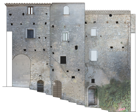
Fig. 10- Prospetto meridionale con ingresso al castrum (elaborazione grafica di M. P. Testa)

L'elaborazione della nuvola di punti è avvenuta mediante il software FaroSCENE , versione 7.5 (2019), che elabora e gestisce i dati scansionati. L'integrazione tra i prodotti delle due metodologie ha consentito di ottenere un modello quanto più dettagliato possibile, unendo la visione d'insieme ottenuta grazie alla fotogrammetria digitale aerea e i dettagli forniti, invece, dal rilievo laser scanning.