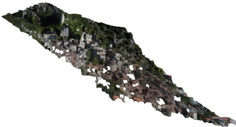
Fig. 6- Profilo territoriale elaborato con il software Agisoft Metashape (elaborazione grafica di M. P. Testa)

targets RAD (Ringed automatically detected) , che vengono rilevati automaticamente e consentono di abbinare più facilmente i punti. Sono stati effettuati cinque voli sul sito, uno con direzione nadirale e quattro inclinati. La fase successiva ha riguardato la restituzione ed elaborazione della nuvola di punti mediante il software Agisoft Metashape , che esegue l'elaborazione fotogrammetrica di immagini digitali e genera un modello tridimensionale, che è stato utilizzato come strumento di ricerca per creare piani ortografici e sezioni del sito (Fig. 6).