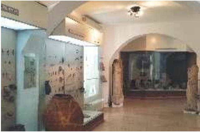
4. Стална музејска поставка (археологија) 4. The Museum's permanent exhibition (archaeology)

отворе лучног облика (Werner 1981), омогућено је стварање великог и отвореног простора за организацију сталне музејске поставке у континуитету и поштовање траженог захтева примене континуалне ходне линије за посетиоце. Постојеће двокрако степениште као вертикална комуникација између два нивоа је постало део ходне линије и „копча” континуалног разгледања сталне музејске поставке на спрату. Касније, у другој фази, када се изгради нови објекат – анекс, постојеће степениште оствариће спој новог простора сталне поставке са постојећим, градећи јединствену функционалну целину (сл. 2). Овакво пројектантско решење омогућило је да се линије кретања посетилаца и запослених у музејским службама нигде не укрштају. На делу унутрашњег простора, оријентисаног према дворишту из Улице Љубе Нешића, постојећи улаз добија функцију службеног улаза, док се у том делу изнад, на првом спрату, налазе простори за Управу музеја и библиотеку. У приземљу остаје просторија за кустоса и санитарни блок (сл. 3).