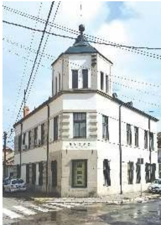
8. Музеј Крајине у Неготину 8. The Krajina Museum in Negotin

Одлука да се проблем сагледа као целина и на тај начин дође до одговарајућих пројектантских решења, а да се реализација замишљеног оствари кроз фазе када се за то створе одговарајући услови, показала се добра. Концепт поступности раста постојећег објекта Музеја Крајине, праћен анализама и израдом радних модела (макета), био је оправдан. Та поступност и етапност огледа се кроз могућност да Музеј спроводи