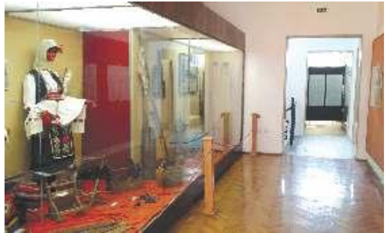
6. Стална музејска поставка (етнологија) 6. The Museum's permanent exhibition (ethnology)

унапред утврђен, тако да су радови протекли у предвиђеној динамици и без накнадних активности.