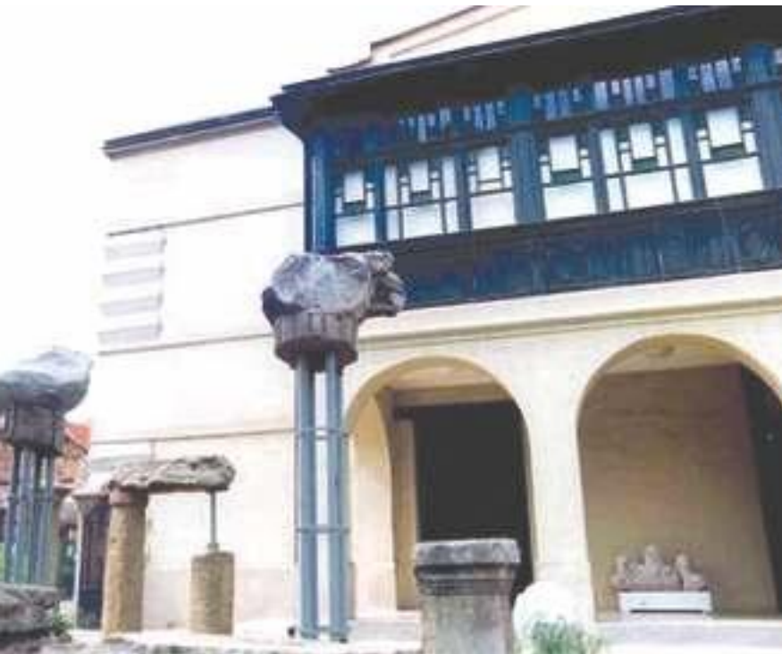
7. Лapidаријум 7. Lapidarium

културе у Борском округу, под бројем СК 335. Ова одлука је велико признање свима који су учествовали у његовој реализацији, од самог почетка (1934) до данашњих дана, као и онима који и данас с пажњом и љубављу брину о њему.