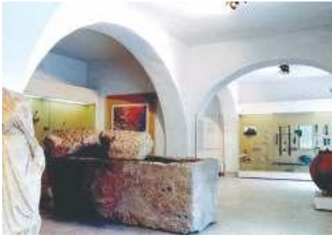
5. Стална музејска поставка (археологија) 5. The Museum's permanent exhibition (archaeology)