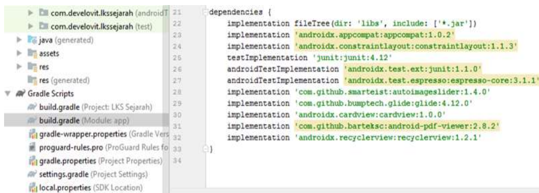
Gambar 1. Build Proyek

Pengembangan aplikasi lembar kerja peserta didik pembelajaran sejarah untuk kelas XII berbasis android menggunakan aplikasi Android Studio. Berikut adalah langkah-langkah pembuatan aplikasi LKPD menggunakan Android Studio. Pertama download dulu aplikasi IDE android Studionya di situs resminya, kemudian install di komputer masing-masing. Setelah aplikasi terbuka, buat Projek baru > pilih Empty Activity > dan buat nama LKS Sejarah > Finish. Setelah proyek terbuat, buka Buil Gradle nya kemudian isikan seperti gambar berikut dan kemudian Build proyek.