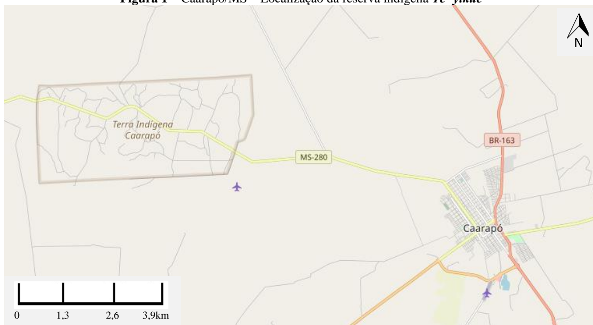
Figura 1 – Caarapó/MS – Localização da reserva indígena Te' yikue

Fonte: https://www.openstreetmap.org/export#map=12/-22.6104/-54.8492