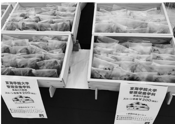
図8 販売した3種類のスコーン