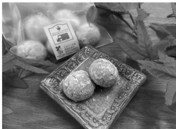
図9 にんじんスノーボールクッキー

10月29日は岐阜県と各務原市の協力のもとイオンモール各務原に出店した。アピタ各務原店同様に相談所を設け、食品ロス削減推進サポーターによる食品ロス削減イベントを実施した。老若男女問わず多くの人々に食品ロス削減の啓発普及活動を展開することができた。このイベントを通して様々な人とコミュニケーションをとることで、新たな商品の開発を行う意欲や、今後も食品ロス削減の啓発普及活動を展開したいという思いを強める機会となった。