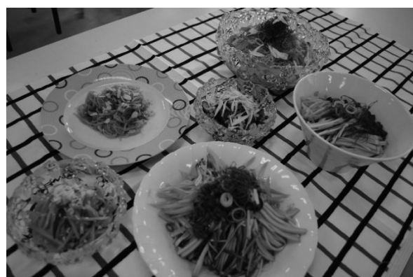
図1 非常食を活用した料理

図2は家庭での余剰野菜を利用した、ミネストローネ、ジンジャーエール豚生姜焼き、カレーグラタン、柚子ジンジャーである。使い道が無いと思っていた食材が学生のアイデア次第で生まれ変わり、食品ロス削減について楽しく学ぶことができた。