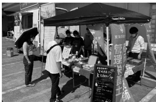
図10 アピタ各務原店にて出店を行う様子