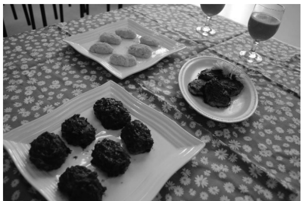
図4 余ったもち米を利用した料理

図4は余ったもち米を利用したおはぎ(きな粉、あんこ、納豆)、コーヒー牛乳である。限られた食材でどのような料理が出来るのかを考えることで、独創的な料理ができ、食品ロス削減の学びも深めることができた。