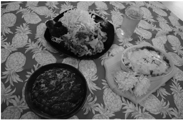
図2 余剰野菜を利用した料理

図3は賞味期限が近いレトルト食品を利用したカレーパン風マフィン、ジェノベーゼ、ラザニア、牛乳寒天である。期限が近い食材を利用することで、食材を使いきるための知恵や、新しい調理技術の発見があり、食品ロス削減に貢献することができた。