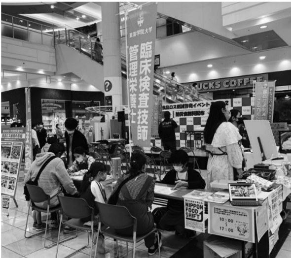
図 11 食品ロス削減推進サポーターが活動を行う様子