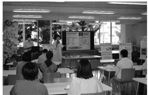
図5 料理教室を行う様子

本学科は「各務原にんじん」を題材に、食育の推進を継承していくという目的や、食品ロス削減について若い世代に学習の場を提供するため、「中高生のための各務原にんじん料理教室2022」を産学官連携のもと、令和4(2022)年度は5回開催することができた。5回のうち5月16日、6月18日の2回は「食品ロス削減」をテーマに行った(図5)。料理教室は講義を30分実施後、調理を60分実施した。残り3回についてはリーフレットを配布し、啓発を行った。