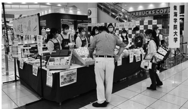
図6 イオンモール各務原でのイベントの様子