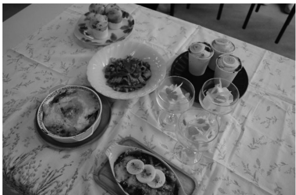
図3 賞味期限が近いレトルト食品を利用した料理

図3は賞味期限が近いレトルト食品を利用したカレーパン風マフィン、ジェノベーゼ、ラザニア、牛乳寒天である。期限が近い食材を利用することで、食材を使いきるための知恵や、新しい調理技術の発見があり、食品ロス削減に貢献することができた。