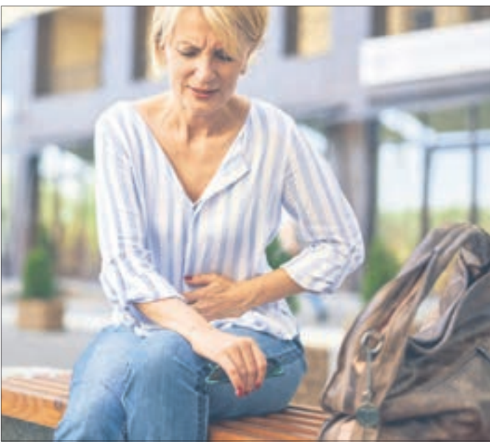
Wiederkehrende Schmerzen in linken Unterbauch können Anzeichen für eine beginnende Divertikulitis sein.