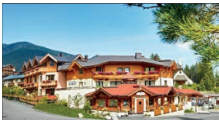
Skyliner über dem Gerlosstein und dem Arena Coaster nach Zell am Ziller hinunter. An die Flanken der Berge geht es auf den Klettersteigen und dem Electro-Trial-Parcours an der Dorbahn in Königsleiten. Die Ferienregion Nationalpark Hohe Tauern ist Europas erste Biomusterregion und das Bio-Wohlfühlhotel Castello Königsleiten seit 2016 von Bio Paradies SalzburgerLand zertifiziert. Zum über-

Am Gerlospass zwischen den Zillertaler Alpen und dem Nationalpark Hohe Tauern atmen Familien auf. Die Natur ist ein riesiger Spielplatz mit Bergen, Seen, Schluchten und den Krimmler Wasserfällen. Das Bio-Wohlfühlhotel Castello Königsleiten ist das Basislager, auch für große und kleine Allergiker. Ein Pflichtprogramm sind die höchsten Wasserfälle Europas, die vom Achenal fast 400 Meter hinunter ins Salztal stürzen. Ein Erlebnis ist aber auch die tosende Leitenkammerklamm im Wildgerlostal. Noch näher kommen Familien den wilden Wassern beim Canyoning in der Zemmschlucht, beim Rafting oder Wildwater Tubing in der Salzach. Ein cooler Sommertipp ist der große Durlassboden-Stausee bei Königsleiten. Mit Schwimmen, Standup paddeln, Kajak und Tretboot fahren, segeln und surfen ist hier immer was los. Im Flug vergehen die Ferien auch mit dem Gipfelfliner über dem Speicherteich, mit Flying Fox über der Dürnbachschlucht, mit dem Arena-