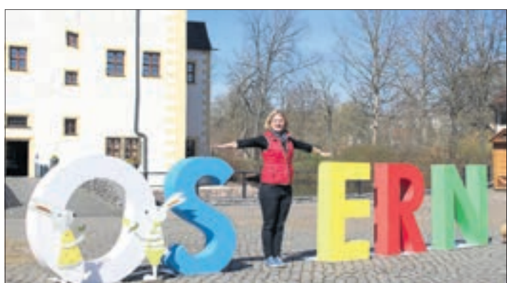
Ein besonderer Spaß für die ganze Familie sind in jedem Jahr die Riesen-Buchstaben, die im Schlosshof aufgestellt sind und zu lustigen Foto-Aktionen animieren.

Jahren. Um das Schlossgebäude, jeweils um 11 und 16 Uhr, können die kleinen Sportler ihr Können unter den Beweis stellen (um eine kurze Anmeldung mit Uhrzeit, Name und Alter des Kindes unter wasserschloss@c3-chemnitz.de wird gebeten). Und am Ostermontag hoppelt auch der Osterhase durch das Schlosssareal. Zusätzlich begeistert am Ostersonntag, 11 und 15 Uhr das Figurentheater oder man begibt sich mit der interaktiven „Schlöserland erleben“-App auf einen Multimedia-Rundgang. Mehr Informationen online unter www.wasserschloss-klaffenbach.de