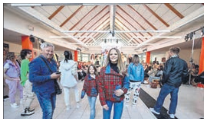
30 Models präsentierten die aktuellen Mode- und Frisurentrends 2023.

so lassen nun gestiegene Energiekosten und Personalprobleme die Friseure nicht unberührt. Dennoch bleibt man optimistisch. „Es wird zwar nie mehr so wie vorher, aber Friseur und Kosmetik bleibt ein Grundbedürfnis der Menschen, das wieder mehr und mehr nachgefragt ist“, sagt Feuerhack. Einen Wandel erlebt das Handwerk momentan in puncto Ausbildung. Die Anzahl der Azubis sei zwar weniger geworden. Dafür wollen immer mehr Friseure ihren Meister machen. jh