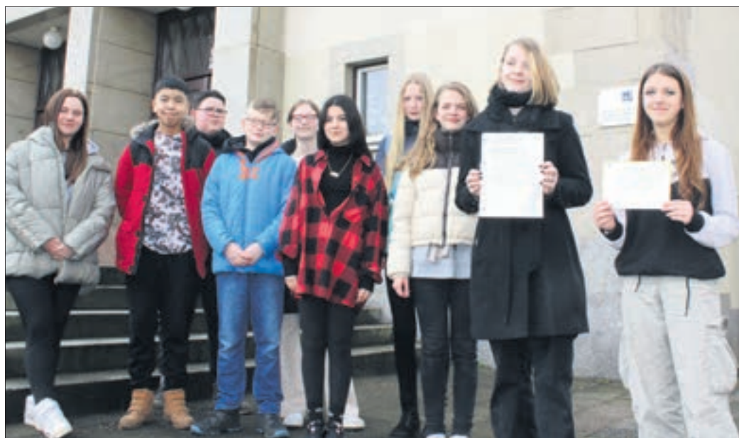
Die Klasse 7a der Annenschule will nicht mit der Grundschule in den Neubau an der Vetttersstraße zusammenziehen.