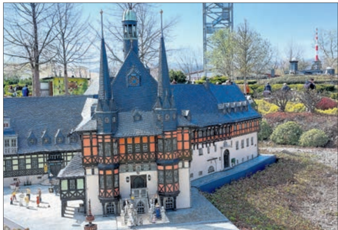
Ein Besuchermagnet ist der Miniaturenpark „Kleiner Harz“ im Wernigeröder Bürgerpark.