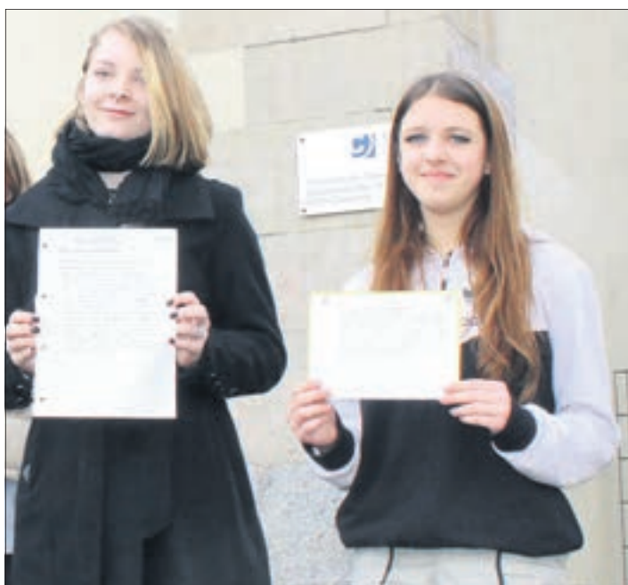
Ihren Unmut über den möglichen Umzug der Grundschule in den neuen Oberschulen-Neubau, machen die Schüler in Briefen deutlich.

Ursprünglich sollte der Neubau der Kooperationschule unmittelbar in der Nähe des Zeisigwaldes entstehen, neben der „Entdeckerschule“ für Kinder mit körperlichen Beeinträchtigungen am Terra Nova Campus an der Heinrich-Schütz-Straße. Jedoch liegen die Arbeiten dort still, außer ersten Erdarbeiten gab es hier noch keine baulichen Fortschritte. Es sei kein Geld da, wie die Finanzpläne der Stadt zeigen. Die Rede war hier inzwischen von bis zu über 50 Millionen Euro, die aufgrund der momentan schwierigen Finanzlage nicht aufzubringen seien. So gibt es aktuell Überlegungen, die Kooperationschule im Gebäude der Annenschule im Reitbahnviertel unterzubringen. Denn die Oberschule zieht zum neuen Schuljahr 2023/24 in den Neubau an der Vetterstraße - ohne Grundschule. So war der Plan. Sollte die Kooperationschule aber tatsächlich in den 1950er Jahre alten Bau wechseln, müssten die Klassen 1-4 der Annenschule ebenso mit in das neue Gebäude in Bernsdorf einziehen. Denn eigentlich sollte für eben diese mit dem Umzug nach Bernsdorf die sonst leerstehende Fläche ausgebaut werden. Die Grundschüler hätten dann das gesamte Gebäude in der Innenstadt für sich. Konkrete Entscheidungen gibt es dazu momentan aber nicht. Die Stadt verweist auf „Variantenuntersuchungen für den Standort der Kooperationschule unter anderem auch die Prüfungen zur Unterbringung der Annenschule im neuen Schulobjekt Vetterstraße“, wie eine Rathaussprecherin auf Nachfrage