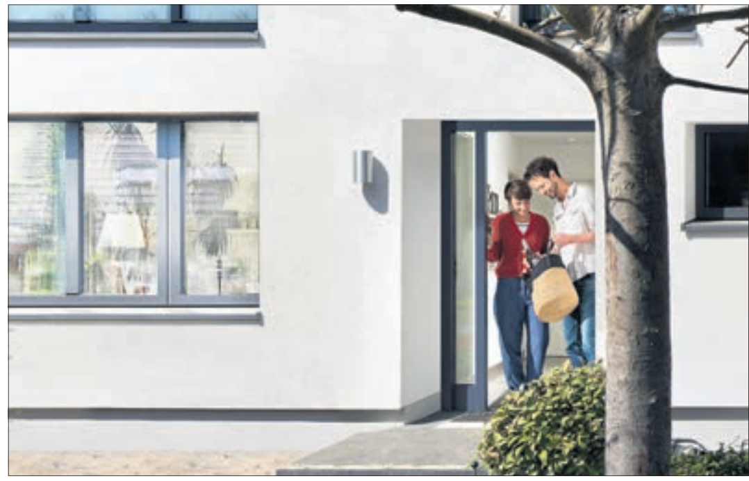
Energie sparen und den Klimaschutz unterstützen: Die Fassadendämmung älterer Gebäude birgt noch enorme Potenziale.

die Kohlendioxid-Emissionen im Eigenheim nachhaltig zu reduzieren, zählt die Fassadendämmung. Ein fachgerecht geplantes und ausgeführtes Wärmedämm-Verbundsystem (WDVS) etwa hält die Wärme besser im Raum und senkt somit den Heizbedarf - angesichts der stark steigenden Energiepreise rechnet sich diese Maßnahme nun noch rascher. Natürlich wird bei der Herstellung eines Dämmsystems ebenfalls Energie verbraucht und Kohlendioxid ausgestoßen. Diese Mengen werden jedoch sehr schnell von den eingesparten Emissionen übertroffen.