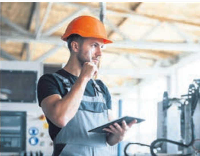
Mit der modernisierten Standardberufsbildposition „Digitalisierte Arbeitswelt“ wird sichergestellt, dass Auszubildende berufsübergreifend Kompetenzen erwerben.

Duale Ausbildungsberufe befähigen für Digitalisierung und Nachhaltigkeit