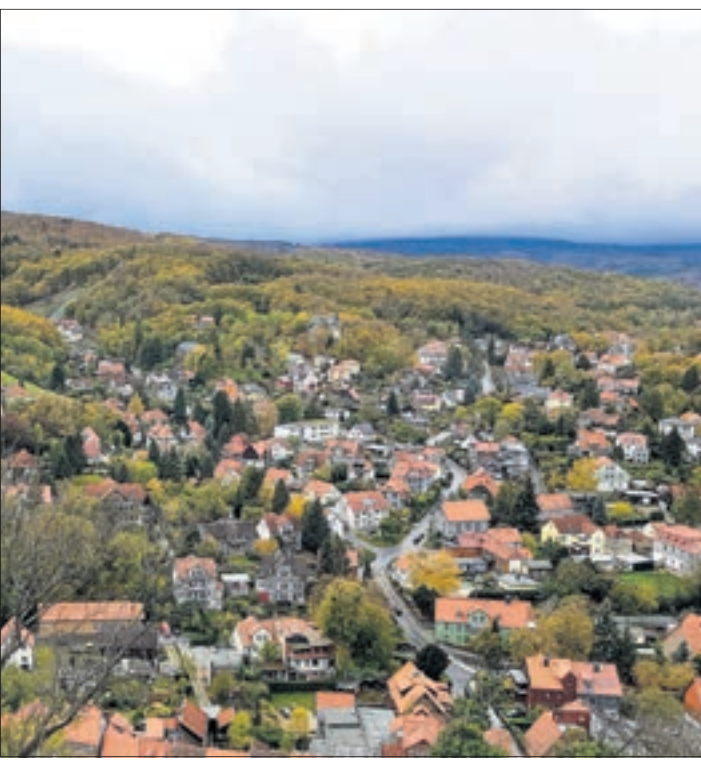
Vom Schloß Wernigerode bietet sich eine schöne Aussicht über die Stadt.