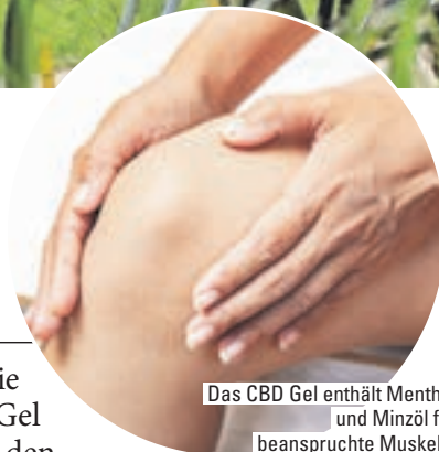
Das CBD Gel enthält Menthol und Minzöl für beanspruchte Muskeln.

mehrmals täglich auf die Haut auftragen. Das Gel wird ganz einfach an den entsprechenden Stellen, wie beispielsweise an Knie, Rücken, Nacken, Hüfte, Armen, Ellenbogen, Schultern und Handgelenken einmassiert. Aufgrund der leichten Formel zieht das Gel schnell ein und fettet nicht. Der Hersteller produziert das Gel in Deutschland und garantiert höchste Qualitätsstandards.