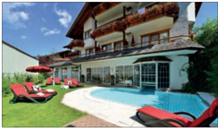
Wandertour mit dem Gastgeber angeboten. Der Walser Bus und die acht geöffneten Sommerbergbahnen zwischen Kleinwalsertal und Oberstdorf sind im Übernachtungspreis inklusive, ebenso Leih-Rucksäcke und Wanderstöcke. In der Sauna, Sanarium oder Dampfbad des Jagdhof-Wohlfühlrefugium werden nach dem Bergerlebnis die Muskeln wieder locker. Verspannungen lösen der alpine Wasserfall im Erlebnishallenbad, die Massagedüsen

Das Voralberger Kleinwalsertal ist als einziges Tal Österreichs ausschließlich von Bayern aus erreichbar. Der Dialekt und die Tracht haben jedoch einen Schweizer Einschlag. Und das ist nicht der einzige „Sonderstatus“, den das malerische Hochtal für sich verbuchen kann. Hier liegt die erste Lebensfeuer-Region Österreichs, eine Zweiländer-Wanderregion mit drei Höhenlagen und 400 Kilometer Wanderwegen – und eine der beliebtesten Urlaubsdestinationen Österreichs. Im Hotel Jagdhof**** von Familie Kessler kommen noch außergewöhnliche Gastgeberqualitäten dazu. Die Zweiländer-Wanderregion hält grenzenlos schöne Touren bereit. Dazu eine Vielfalt an geführten Aktivitäten, E- und Mountainbike-Touren. Im Kleinwalsertal gibt es neben traumhaften Trailrunning-Strecken auch den Walser Umgang. Das sind acht Vitalwege, auf denen sich Gesundheit und Leistung in individuellem Lebenstempo steigern lassen. Da Bewegung in mittleren Höhenlagen besonders gesund und effektiv ist, wird einmal pro Woche eine