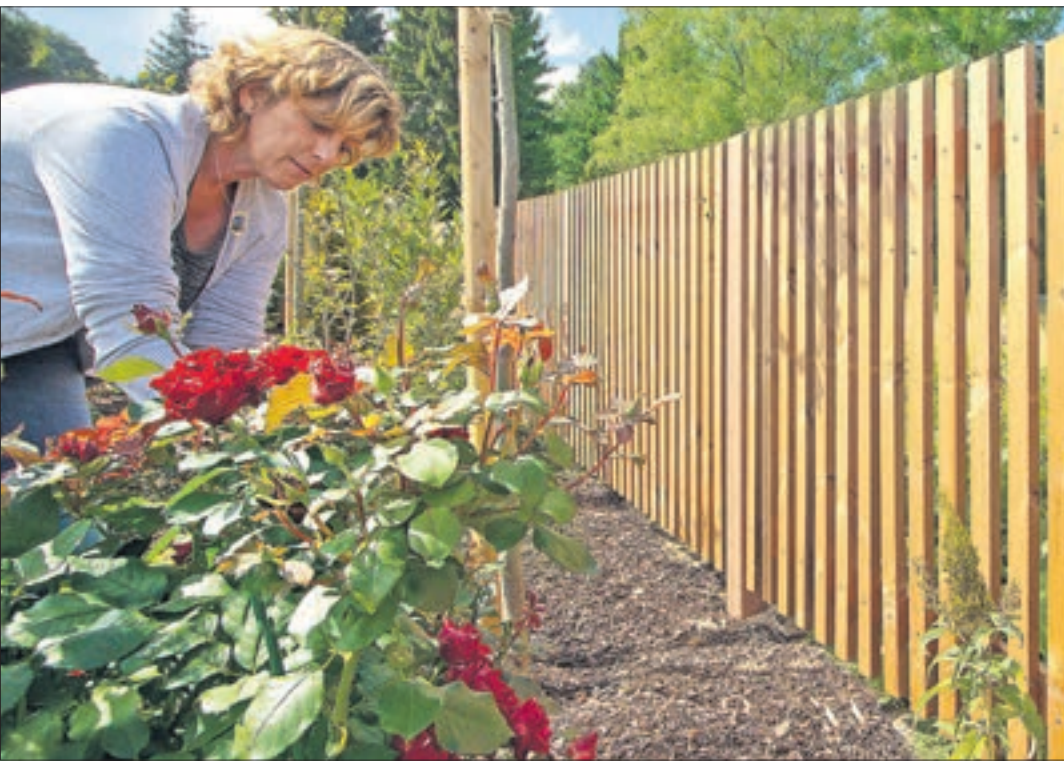
Vom Sichtschutz bis zum Terrassenbelag: Der nachwachsende Rohstoff Holz bietet für den Garten unzählige Gestaltungsmöglichkeiten.

Für eine attraktive und natürliche Gartengestaltung ist Holz unverzichtbar. Schließlich lässt sich der nachwachsende Rohstoff vielseitig im Außenbereich verwenden, zum Beispiel als Sichtschutz, Grundstücksbegrenzung oder Sandkasten für die Kids. Auch zum Bau eines Hochbeets, als Terrassenbelag oder Sitzmöbel eignen sich Holz und Holzprodukte. Damit es dauerhaft den Witterungsbedingungen standhält, kommt es auf sachgemäße Konstruktion, geeignete Qualitäten und regelmäßige Pflege an.