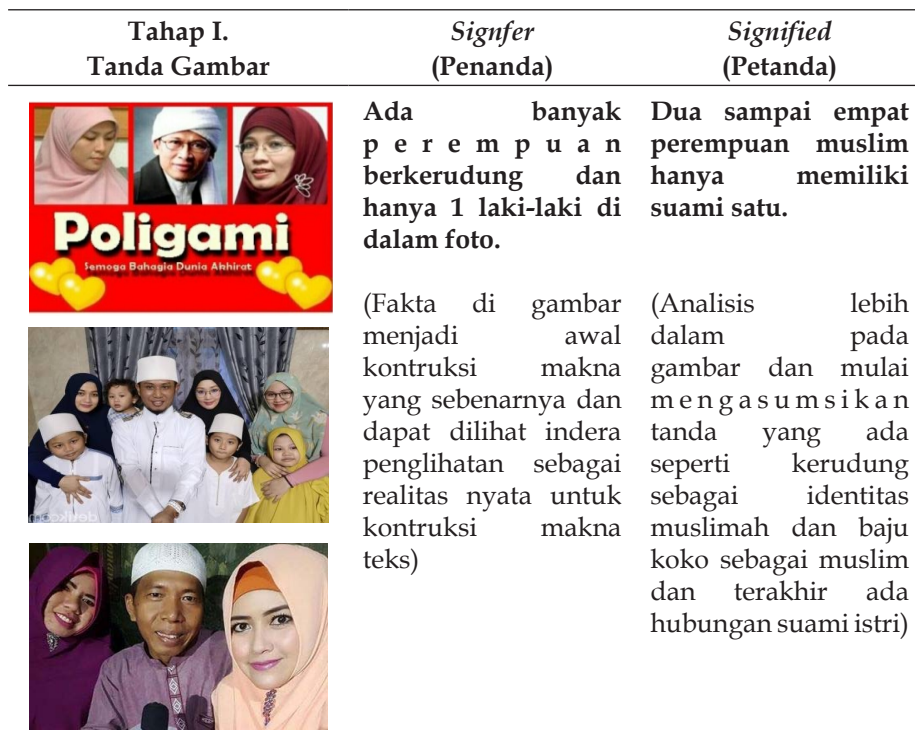
Tabel 1. Tahap 1 analisis penanda dan petanda dalam gambar poligami tokoh publik Indonesia