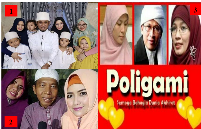
Gambar 2. Gambar Fenomena Poligami pada Tokoh Publik Indonesia (Tokoh Politik, Artis dan Da'i/Ustaz)