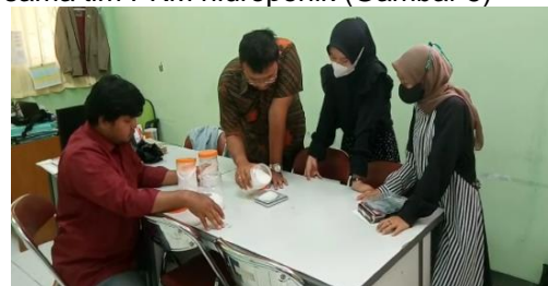
Gambar 5. Peracikan Nutrisi esensial hidroponik bersama tim PKM

Selain membuat sendiri, pembuatan nutrisi esensial hidroponik juga dilakukan Bersama tim PKM hidroponik (Gambar 5)