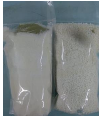
Gambar 3. Nutrisi esensial AB mix hidroponik

Kegiatan utama dalam kegiatan PKM ini adalah pembuatan nutrisi esensial hidroponik. Nutrisi hidroponik terdiri dari nutrisi A dan nutrisi B, nutrisi ini mudah ditemukan di toko pertanian yang khusus menjual pupuk hidroponik. Kandungan nutrisi A terdiri dari unsur hara makro yaitu Kalium Nitrat ( KNO_3 ), Kalium Sulfat dan Kalsium Nitrat dan unsur hara mikro yaitu Fe-6%. Kandungan nutrisi B terdiri unsur hara makro yaitu MKP, MAG-S, MAP, MKP, FLEX-G dan unsur mikro yaitu Vitaflex. Nutrisi esensial hidroponik yang dibuat kemudian ditambahkan air sebanyak 5L dan diberikan kepada sayuran hidroponik sesuai umur sayuran hidroponik (Gambar 3)