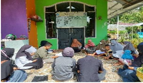
Gambar 8. Pelatihan pemasaran bersama ketua, anggota hidroponik dan Ibu PKK sekitar tempat PKM (Dokumentasi Pribadi)

Selain itu tim PKM juga melakukan pembuatan Instagram (Gambar 9) untuk membantu dalam kegiatan pemasaran. Nama Instagram yaitu smarthidroponik . Adanya pembuatan instragram, pemasaran sayuran hidroponik semakin cepat dan semakin banyak pembeli yang membeli sayuran hidroponik. Adanya media sosial ini pemasaran semakin cepat dan terjadi peningkatan ekonomi di kelompok tani smart hidroponik