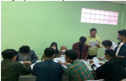
Gambar 7. Pelatihan analisis usaha tani bersama ketua dan anggota hidroponik

Kegiatan pelatihan analisis usaha tani yang dilakukan oleh tim PKM untuk membantu kelompok tani Smart hidroponik dalam menghitung keuntungan dalam usaha hidroponiknya (Gambar 7).