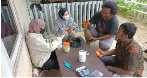
Gambar 6. Peracikan Nutrisi esensial hidroponik bersama ketua dan anggota hidroponik (Dokumentasi Pribadi)