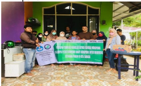
Gambar 2. Sosialisasi Kegiatan