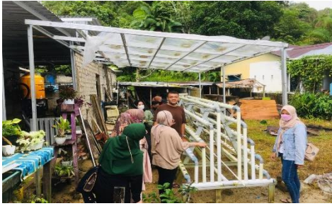
Gambar 1. Survei Kegiatan