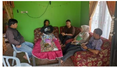
Gambar 10. Evaluasi PKM

Kegiatan selanjutnya yang dilakukan tim PKM adalah diskusi untuk mendapatkan informasi dari mitra pengabdian dalam hal ini kelompok tani Smart Hidroponik tentang peningkatan pengetahuan dan manfaat yang telah didapatkan dari kegiatan PKM ini.