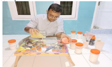
Gambar 4. Peracikan Nutrisi esensial hidroponik Sendiri

Tahapan pertama dalam pembuatan nutrisi esensial hidroponik yaitu membuat nutrisi secara pribadi untuk mempersiapkan nutrisi selama kegiatan PKM berlangsung (Gambar 4).